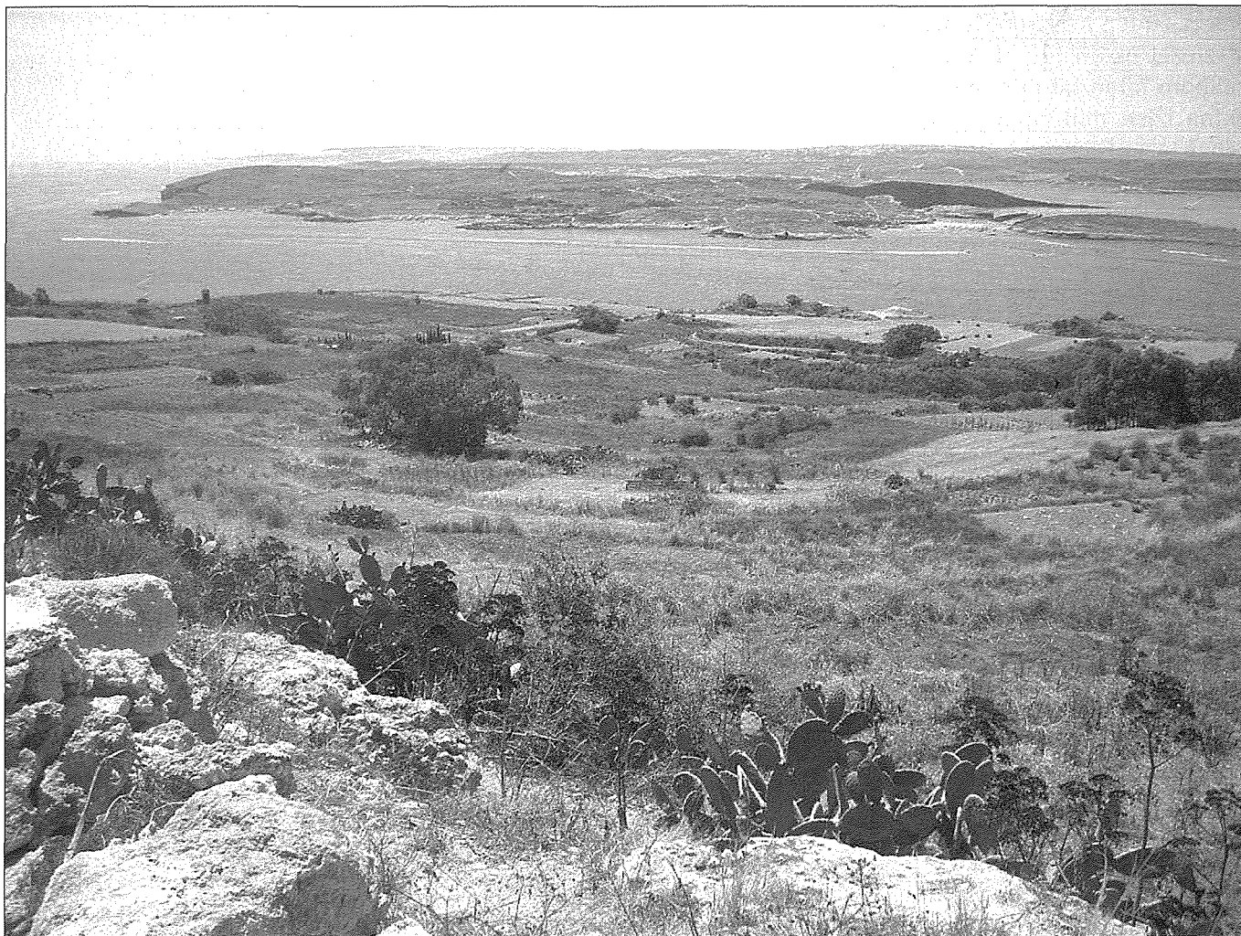
Parti tal-Wardija li sfrondiet meta waqaf it-theżżiż. Ritratt minn Triq Barbaġann, il-Qala.

sena wara, propjament fit-12 ta' Ottubru 1856 li saru aktar konsenturi wara terrimot li seħħ ta' qawwa 7.7 qrib il-Gżira ta' Kreta fil-Greċja u nħass sew fil-Qala. B'konsegwenza ta' dan it-terrilot kienu tfaċċaw aktar konsenturi li mtlew wara xogħol ta' tiswija.