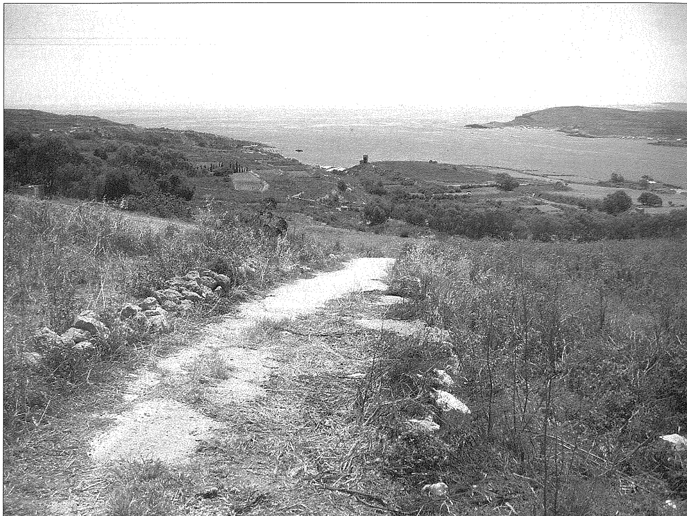
Parti ta' isfel tal-Wardija li sfrondiet meta waqaf it-theżżiż. Ritratt minn Triq Tač-Čawl, il-Qala.

rdumijiet żgħar oħra. Dan jixhduh il-ġeologisti Maltin u l-mappa uffiċjali tal-Gvern. L-Irdum iż-Żgħir jibda mill-Bajja ta' Hondoq ir-Rummien minn taħt fejn hemm dak li kien distillatur tal-ilma lejn taħt Triq il-Barbaġann tul Triq il-Wardija lejn ir-rawndabawt u Triq Patri Ġuzepp Portelli għal go Wied Biljun u jispicċa fil-Port tal-Imġarr. Għalhekk, għalkemm minn fuq wiehed jaħseb li l-Wardija hi magħquda mal-kumpliment tal-Gżira Għawdxija, fil-verità mhix għax taħt l-art hi separata daqs li kieku kienet 'gżira'.