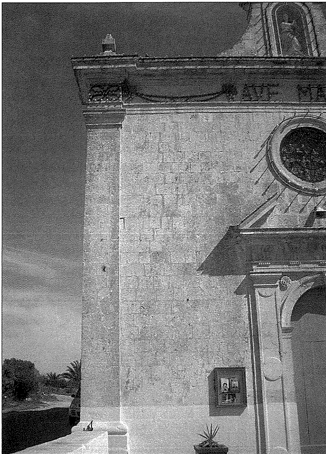
In-naħa tax-xellug tal-faċċata tas-Santwarju tal-Kuncizzjoni tal-Qala fejn hemm konsenturi u waħda distintament sostanzjali kawża tat-terrimot tal-1743.

dam isqof tal-Gżejjer Maltin għal 29 sena shaħ 2 . Huwa ta' donazzjoni ta' deheb u fidda sabieħ tisewwa l-ħsara li kien kkawża dan it-terrimot. Dan l-Isqof Spanjol li twieled f'Aquien, f'Spanja gie mfahhar minn Giovanni Pietro Agius de Soldanis fid-daħla tal-ktieb tiegħu dwar l-Istorja t'Għawdex fejn jgħid: