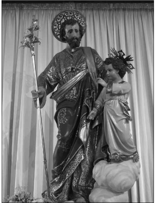
L-istatwa ta' San Ġużepp, illum meqjuma fil-knisja parrokkjali, xogħol ta' artist mhux magħruf.

26 Għalkemm fl-original insibu "Congregazione", "Confraternità" jew "Sodalità" hawn se nużaw dejjem "Kongregazzjoni."