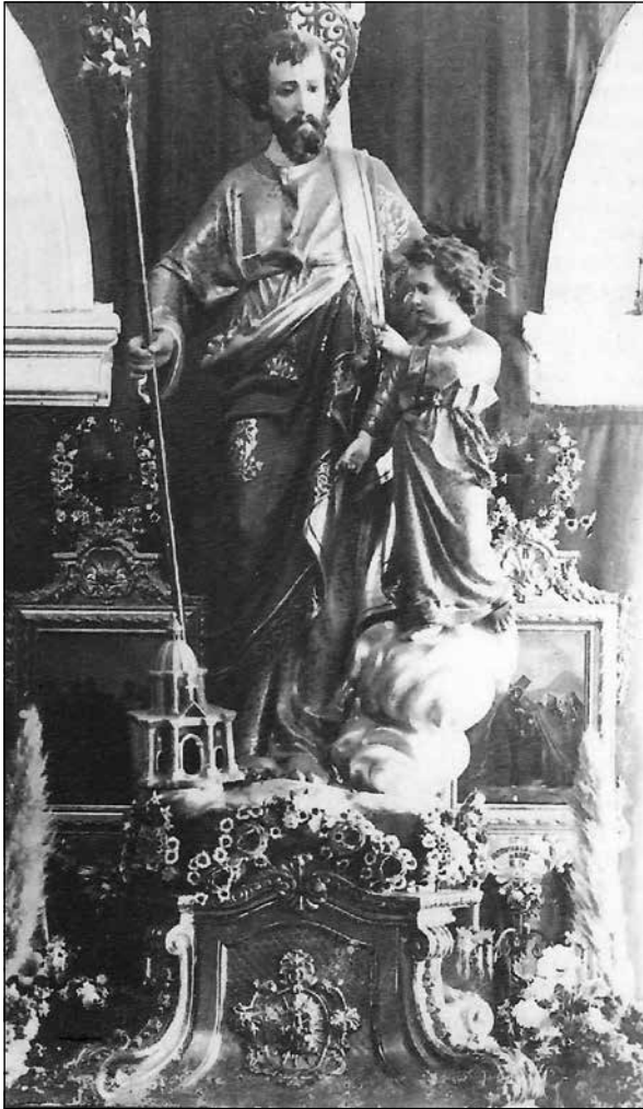
L-istatwa ta' San Ġuzepp, armata għall-festa tal-patroċinju fil-knisja parrokkjali l-antika, xogħol ta' artist mhux magħruf

Barra minn dan kollu hemm il-kwistjoni li tikkonċerna l-flus. Kull membru kellu jhallas 10 xelini biex ikun membru sħiħ u dawn setgħu jithallsu fi żmien sentejn (punt 37). Tissemma' wkoll annwalità (punt 24) imma mkien ma hemm imsemmi din kemm kienet. Il-punt xi ftit skomdu dwar il-flus huwa n-numru 8 fejn jingħad li huma biss il-membri li jkunu hallsu l-10 xelini tal-iskrizzjoni li kellhom dritt għad-daqq tal-agunija, il-quddiesa ta' qabel il-mewt u l-oħra ta' wara. Dan kollu jagħti l-impressjoni li t-talb wiehed jirċevih jekk ikollu minn fejn iħallas. Apparti minn hekk fil-punt 17 naqraw li r-Rettur, li ma kien hadd għajr il-Kappillan, kien intitolat jieħu 6 soldi għal kull persuna li kienet tipprofessa. Dan jista' jiġi interpretat li l-Kappillan kien qed ifittex modi kif jaqla' xi haġa wkoll.