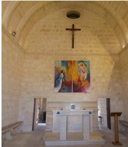
Iż-żewġ artali quddiem xulxin

żewġt iġnub tal-altari hemm dukkiena tal-ġebel. Fuq kull naħa tal-altari hemm bieb żgħir li jagħti għas-sagrastija fuq wara tal-knisja.