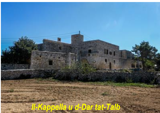
Il-Kappella u d-Dar tat-Talb

f'testament ta' Margarita d'Aragona de Peregrino, nobbli ta' nisel Spanjol, u li kienet il-mara ta' Giacomo de Peregrino li kien imlaħħaq bħala l- "Kaptan ta' Malta" mir-Re ta' Sqallija nnifsu, fejn din ħalliet il-knisja ddedikata lill-Annunzjazzjoni flimkien mal-kunvent ta' magħha fl-inħawi ta' San Leonardu. Żgur li fl-1446 il-komunità tal-patrijiet Karmelitani li kienet tgħix f'dan il-kunvent kienet diġà stabbiliet ruħha bħala komunità awtonoma bil-pirjol tagħha.