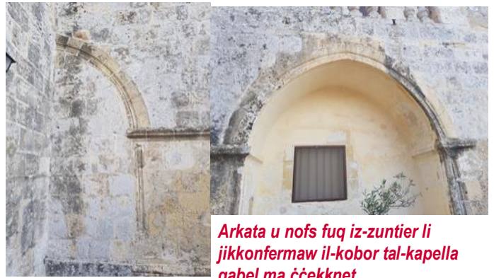
Arkata u nofs fuq iz-zuntier li jikkonfermaw il-kobor tal-kappella qabel ma iċċekknet.

Il-knisja, minkejja li fiż-żmien kienet iċċekknet, hija relattivament imdaqqsqa u tesa' madwar 50 ruh bil-qiegħda. Illum għandha zuntier imdaqqs li fih daqs nofs il-knisja innifisha. Fuq kull naħa taz-zuntier insibu arkata u nofs imdaħħlin fil-ħajt li qabel, meta l-knisja kienet akbar, kienu fuq ġewwa u kienu jservu bħala l-apside għall-altari laterali. Iz-zuntier huwa fil-livell tat-triq tista' tgħid imma l-knisja titla' għaliha b'żewġ targiet.