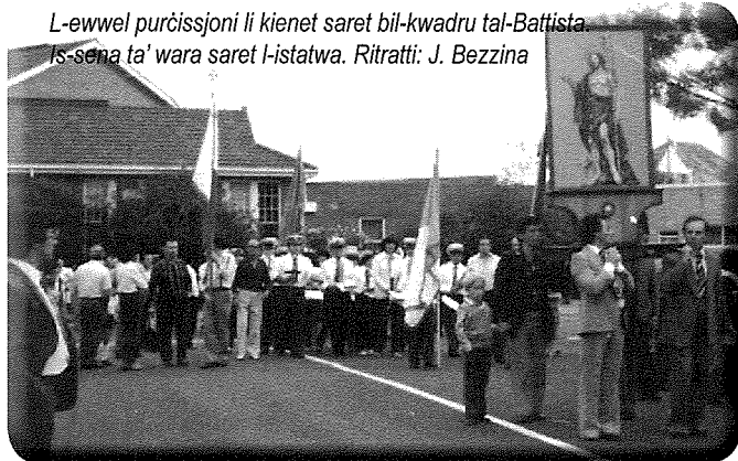
L-ewwel purċissjoni li kienet saret bil-kwadru tal-Battista is-sena ta' wara saret l-istatwa.

Id-demmi ibaqbaq ta' kull Xewki għall-festa li niċċelebraw bil-kbir kull sena għal-aħħar ta' Ġunju, giegħel lill-ħutna emigranti, biex huma wkoll, f'pajjiż daqstant 'l bogħod minn xtutna u b'kultura tant differenti minn tagħna, jirnexxielhom jingħaqdu u jorganizzaw festa hekk kbira, sena wara sena. Barra il-festa, dan il-kumitat għamel ukoll ħafna armar li jkompli zżejjen din il-festa.