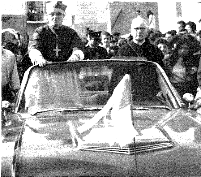
tqegħid tas-salib fuq il-koppla

Kien bniedem kuraġġjuż u perseveranti. Kien il-kuraġġ li wasslu biex intefa' b'ruħu u b'għismu għax-xogħol tal-pjanti u tal-permessi tal-knisja l-għdida mingħajr ma kien għadu lanqas għabar sold. Hadedem kemm feleħ u tħabat għall-għbir tal-flus bid-diversi inizjattivi li kien jieħu b'risq il-bini tal-knisja.