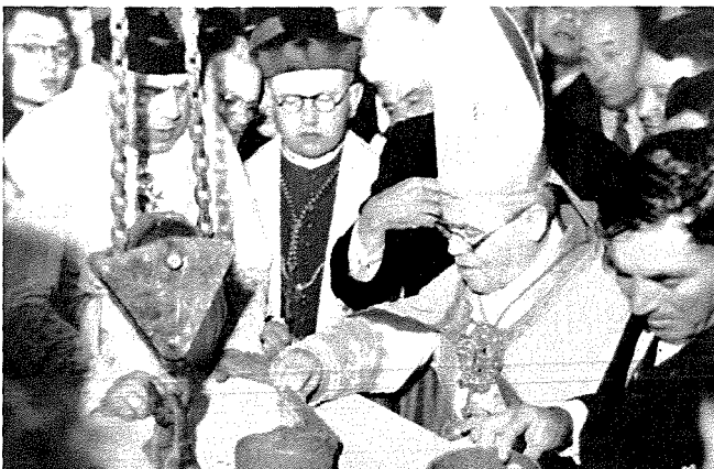
tqegħid tal-ewwel ġebbla

Fit-13 ta' Settembru 1951 inbeda l-ippjanar tal-knisja l-ġdida. It-tqegħid solenni tal-ewwel ġebbla sar fl-4 ta'