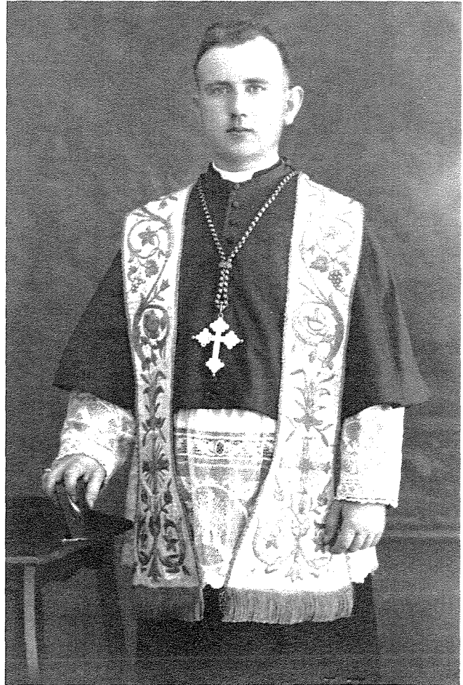
Fl-okkażjoni tal-pusses tiegħu

Ir-rabta li rabtitu sa tmiem ħajtu mar-raħal tax-Xewkija bdiet fit-8 ta' Mejju 1946 meta nħatar Arċipriet-Kuġitur, 'cum futura successione', tal-Arċipriet Dun Anton Grima. Ħa l-pussess ta' arċipriet b'solennità kbira fil-11 t'Awwissu 1946 minn Mons. L. Cordina, Arċidjaku u Delegat tal-Isqof Pace. Imbagħad fid-9 ta' Frar 1947, Dun Ġużep Grech ħa l-pussess ta' arċipriet din id-darba