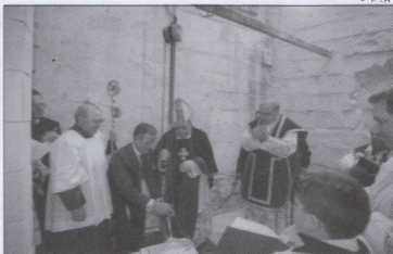
Mons Isqof iqieghed l-ewwel ġebbla tal-Kappella.

I-istatwa devota u artistika ta' San Ġorġ, il-ġieħ tal-Bazilika Ġorġjana, ġiet esposta fil-Knisja matul il-jiem tal-festa liturġika. Nhar 19, 20, u l-21 ta' April ġie iċċelebrat it-Tridu Solenni, b' Quddiesa kantata, Adorazzjoni u Barka Sagramentali. Attivita' kulturali li saret b'konnessjoni ma' dawn il-festi, b'kollaborazzjoni mal-British Council, kien il-Kunċert Muzikali mill-Edinburgh String Quartet (Scotland). Minbarra li wieħed seta' japprezza l-livell impekkabbli ta' dawn il-muziċisti professjonali, li mhux l-ewwel darba li ġew ġewwa l-Bazilika, hadna gost naraw ukoll kemm kunċerti bhal dawn qed jattiraw numru dejjem akbar ta' barranin li joqogħdu Malta lejn il-Bazilika ta' San Ġorġ. Nhar il-Madd, 21 ta' April, saret l-ikla tradizzjonali ta' San Ġorġ, organizzata mill-Ladies Society.