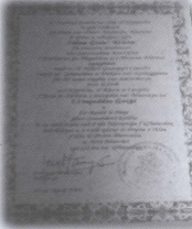
Il-parċmina tad-Dedikazzjoni tal-Kappella.