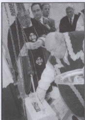
Mons Salv Borg ipogġi id-dokumenti fl-ewwel gebla.