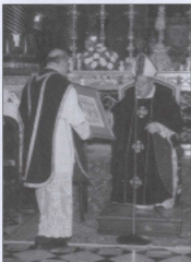
Mons Arcipriet jipprezenta riġal lil Mons Isqof f' tmiem il-Pontifikal.