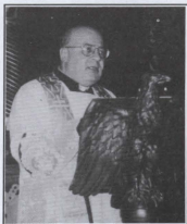
Mons Arcipriet jagħti merħba lil-Leġjunarji