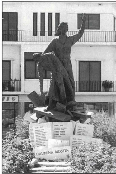
Il-mafkar ad unur 'Il-Qalbiena Mostin' li hallew hajjithom f'ċirkostanzi differenti, u li jinsab f'tarf Triq il-Kungress Ewkaristiku.