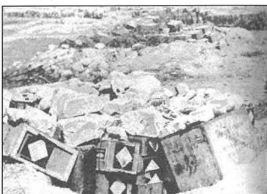
Kaxxi bil-ikel mgħottijin bil-ġebel halli ma jintgħartux mill-bdoti ta' l-ajruplani ta' l-għadu.

Dawk imbagħad - serq ta' ikel mill-garaxxijiet, ufficjal mixli li seraq xi l-ċs minn djar imġarrfin, bejgħ ta' hobża lira, xkora dqiq erbghin lira jew aktar jew titpartat mad-deheb. Inċidenti patetiċi bħal ta' Dun Ġużep Mifsud ('Tal-Lavalora') li ntradam f'daru fi Triq il-Kbira. Sabuh mirdum imkeffen minn rasu sa saqajh bħal huta mkebbha fid-dqiq. Dun Ġużep kellu fobja għat-trab tant li kien