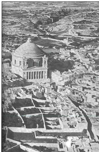
Ritrat mill-ajru tal-Mosta fit-tletinijiet bir-Rotunda tiddomina fuq il-bini tal-Mosta.

Il-pajjiżi nvoluti fil-gwerra akkużaw lil xulxin li