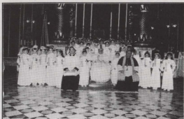
IT-TFAL BNIET LI RCEVEW L-EWWEL TQARBINA - 17 - 5 - 95

Il-Ġimgħa Ewkaristiko-Liturgika nżammet fil-parroċċa tagħna bejn il-Madd 14 ta' Mejju u l-Madd 21 ta' Mejju il għadda. Fost l-attivitàtjiet l-iktar importanti kelina l-Ewwel Tqarbina u l-aministrazzjoni tas-Sagrament tal-Konfermazzjoni illi numru ta' tfal milli-Parroċċa. Ta' min irodd ħajr illi-katekisti li matul dawn l-aħħar snin wasslu illi dawn biex jirċievu l-Ewwel Tqarbina jew il-Grizma ta' l-Isqof. Il-Ġimgħa Ewkaristiko liturgika ġiet fit-tmiem tagħha bil-Kwaranturi. Il-Kwaranturi Solenni għalqu b'Konċelebrazzjoni Pontifikali mmexxija minn Mons Isqof u Purċissjoni bis-Santissimu Sagrament mat-toroq ta' Beltna. Bħal ma' kien isir il-Imghodd li ngħatat il-Barka Sagramentali quddiem il-Knisja ta' San Ġakbu fil-Pjazza Indipendenza. Sakemm dan ma setax isir it-tieni Barba Sagramentali kienet qed issir il Triq Palma.