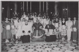
TFAL BNIET LI RCEVEW IL-GRIZMA TA' L-ISQOF - 19 - 5 - 95