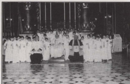
TFAL SUBIEN LI RCEVEW L-EWWEL TQARBINA - 17 - 5 - 95