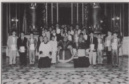
TFAL SUBIEN LI RCEVEW IL-GRIZMA TA' L-ISQOF - 19 - 5 - 95