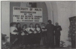
Il-Kor "Laudate Pueri" fiċ-Cerimonja ta' l-Inawgurazzjoni taċ-ċentru f'Għawdex ta' l-Universita ta' Malta.

Dumnikani, ir-Rabatta' ta' Malta, organiżżat mill-'World Council of Women'. Rapport li deher fil-ġurnal ewlieni 'The Sunday Times' tal-25 ta' April 1993 iddeskriva l-kant bhala sublimi.