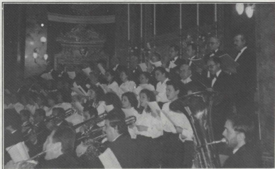
Il-Kor "Laudate Pueri" fil-Knisja ta' San Publiju fil-Furjana.

Fid-19 ta' April il-kor kien mistieden biex ikanta waqt servizz ekumeniku li sar fil-kunvent tad-