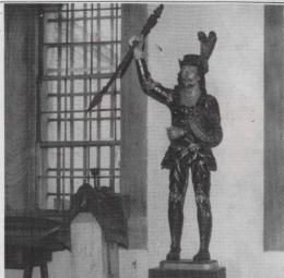
Statwa ta' San Ġorġ fil-Brazil fuwiehed mill-mużewijiet.

Ta' min isemmi li l-awtoritajiet ċivili kienu jilqgħu bl-aktar dinjità lil xi 'awtorita' li tiġi fil-belt tagħhom. Nhar il-festa ta' "Corpus Christi" fil-belt l-awtoritajiet kienu jmorru jeħdu sehem fil-purċissjoni bl-ikbar rispettu u bl-ilbies propju. Billi, kif għidna qabel, San Ġorġ kien meqjus bħala 'bniedem-qaddis' li għadu haj, l-awtoritajiet ċivili għamlu statwa ta' l-injam ta' San Ġorġ. Din l-istatwa, li illum hafna minnhom jinsabu fil-mużewijiet, kienet hekk: San Ġorġ kien ikun liebes ta' suldat u kien ikollu saqajh u idejh jitharrku sabiex ikun jista' jitpoġġa faċli fuq iż-żiemel. Kien jiftah dawn il-purċissjonijiet Ewkaristiċi San