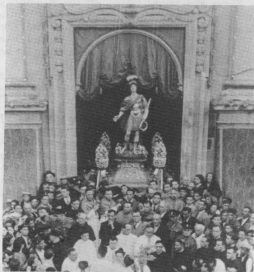
Il-hruġ tal-purċissjoni bl-istatwa ta' San Ġorġ fil-bieb ewlieni tal-Bażilika waqt li qed jindaqq l-Innu 'A San Giorgio Martire' fl-1947.

Fi-8.15 a.m. Konċelebrazzjoni li fiha jsir talb għall-benefatturi haġjin u mejtin tal-Bażilika. Mistiedna l-emigranti ġorġjani li jkunu ġew fostna. Fit-tmiem tal-Quddies jitkanta Te Deum bħala eħliuq tat-Tridu. Fi-9.30 a.m. Marċ brijuż mill-Banda La Stella minn Pjazza San Ġorġ sal-Kažin.