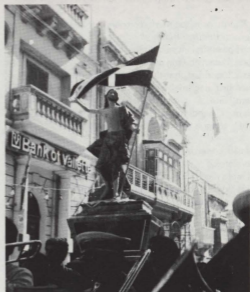
L-Istatwa antika ta' Kristu Rxoxt tidher għaddeja għall-ewwel darba minn Pjazza t-Tokk, akkumpanjata mill-Banda La Stella, waqt id-Dimostrazzjoni ta' Hadd il-Ghid.

Sa fejn hu magħruf din kienet l-ewwel Dimostrazzjoni bl-istatwa ta' Kristu Rxoxt li qatt saret fil-belt Victoria.