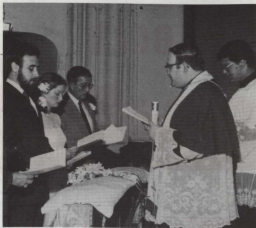
Il-Kan.Dun Koronat Grima waqt ċerimonja ta' żwieġ fil-parroċċa tiegħu ta' San Ġużepp

Kull meta niġi bżonn tal-għajuna tan-nies dejjem insibhom lesti u jilqgħuni b'idejhom miftuha. Nista' nġhid li l-pjaċir taġġhom huwa propju meta nitlobhom l-għajnuna taġġhom. Mis-sena l-oħra l'hawn l-għajnuna min-nies li jiġu l-knisja żdiedet sewwa għax il-Gvern beda jaġġti 42p għal kull €1 li kull persuna taġġti fil-ġbir tal-knisja. Dan ifisser li min-naħa tan-nies, mingħajr ma jaġġtu xejn aktar, ikunu qed jaġġtu 42 p aktar għax il-Gvern inaqqasilhom dawn il-flus mit-taxxa. Din tissejjaħ il-Covenant Scheme, skema li teżisti wkoll f'pajjiżi oħra.