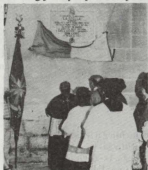
L-Isqof Cauchi jidher jikkex il-lapida commemorattiva.

Wara mitt sena ta' festi kbar f'għieh il-patrun taghna San Ġorġ jixraq li nsemmu l-ewwelnett lill-Kumitat prezenti tas-Socjetà Filarmonika LA STELLA u nringrazzjawh għal mod kif ġew organizzati l-festi ta' barra ta' din is-sena li mhux biss jagħmlu unur ilna imma jagħmlu unur ukoll lill-Ghawdex taghna. Però ma rridux inhallu barra lil dawk ta' qabilna li għal dawn l-aħħar mitt sena ma qatghu xejn mill-hidma biex jkomplu dejjem ikabbru l-festi ta' San Ġorġ. Minn qalbna nroddulhom haġr, lil dawk li hallewna nitolbu għalihom u lil dawk prezenti nkomplu nghinuhom biex minn sena għall l-oħra jkomplu jhabirku biex il-festi ta' San Ġorġ jkomplu jikbru u jtsbiehu.