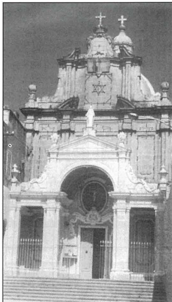
Il-knisja tal-Madonna tal-Herba f'Birkirkara.

Id-devozzjoni lejn il-Madonna fil-gzejjer Maltin huma diversi. Ghandna kappelli, knejjes u santwarji taht il-harsien ta' Ommna Marija. Ghaliex?