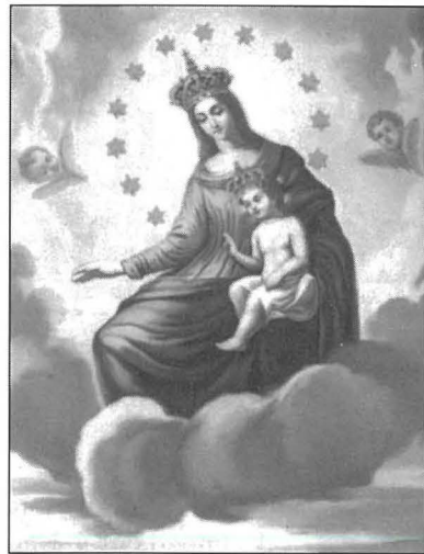
Dettall mill-kwadru tal-Madonna tal-Herba. Kien ġie nkurunat fis-7 t'Awwissu 1910.