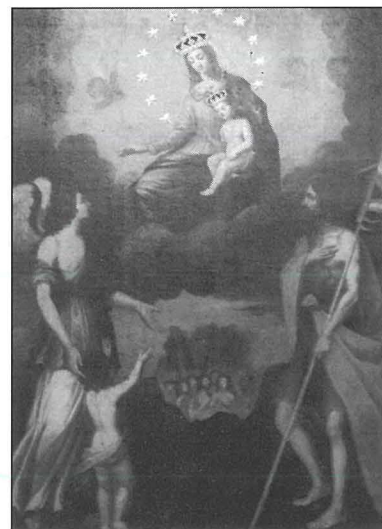
Il-kwadru titolari, 1668-1679.

Wiehed mis-Santwarji Marjani fil-gzejjer Maltin ta' fama u devozzjoni kbira huwa bla dubju dak tal-Madonna tal-Herba f'Birkirkara. Dan is-Santwarju jinsab tefgħa ta' ġebbla l-bogħod mill-Kolleġġjata Bazilika ta' Sant'Elena, jew ahjar fuq in-naha ta' wara tal-Kolleġġjata.