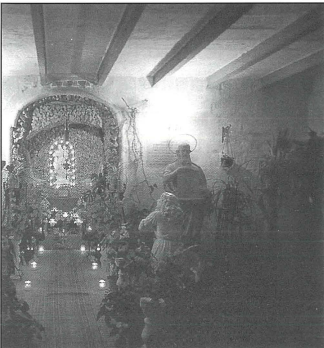
L-Għar f'Wied il-Għasel li dahlet tiskenn fih 'Marija Grazzja'.

"Kursari! Madonna tas-Sema u ta' l-art", temtmet, wiċċha isfar lellux. X'irid ikun! Niġri b'kemm għandi sahha. Il-Madonna tagħtini grazzja nehles minn dwiefirhom. Imma biex inpattilha?