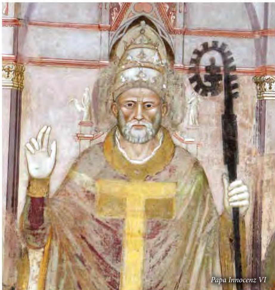
Papa Innocenz VI

aktar 'il quddiem. San Luqa jghidilna li Ġesù “tbiegħed minnhom daqs tefgħa ta’ ġebbla” (Lq 22,40) meta mar jitlob. Dawn id-dettalji nistgħu nispjegawhom b’mod loġiku jekk inharsu lejn it-topografija tal-Ġetsemani. Ġesù u l-Appostli dahlu jistkennu fl-Għar li fih kienu jgħaddu l-lejl, post familjari anke għal Ġuda t-traditur, li fil-fatt imur hemm mal-għases tal-Lhud biex jaqbad lil Ġesù u jittradih, wara li Ġesù irritorna mit-talb. Id-distanza bejn l-Għar-Knisja tal-Ġetsemani u