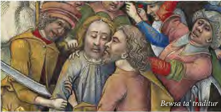
Bewsa ta' traditur

Il-Vangeli jiddeskrivu l-Ġetsemani bhala "qasam" ( villa ) jew "ġnien" li kien hemm fuq ix-xaqliba tal-lvant tal-Wied tal-Kedron, fejn Ġesù kien jingabar mad-dixxipli tiegħu, u fejn x'aktarx kienu jsibu kenn bil-lejl meta jkunu Ġerusalemm. Ġw 18,1-12 jghid: "Ġesù hareġ mad-dixxipli tiegħu u qasam ghan-naħa l-oħra tal-Wied ta' Kedron; hemmhekk kien hemm ġnien, u dahal fih mad-dixxipli tiegħu. Ġuda, dak li ttradih, kien jafu l-post, għax Ġesù kien sikwit jingabar hemm mad-dixxipli tiegħu." Kien f'dan il-post li Ġesù mar jitob wara l-aħħar ċena.