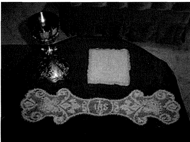
Il-palla tal-kalċi u s-suprakalċi