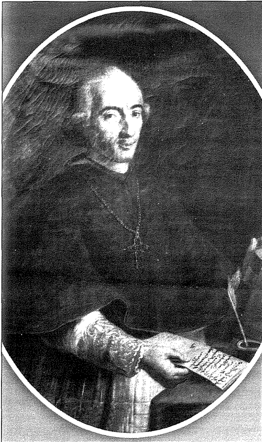
Kardinal Fabrizio Scerberras Testaferrata

Bit-tħabrik u l-għajnuna finanzjarja tiegħu, il-Kardinal Scerberras Testaferrata bena għadd ta' skejjel, kunventi, sptar, u orfanatrofji.