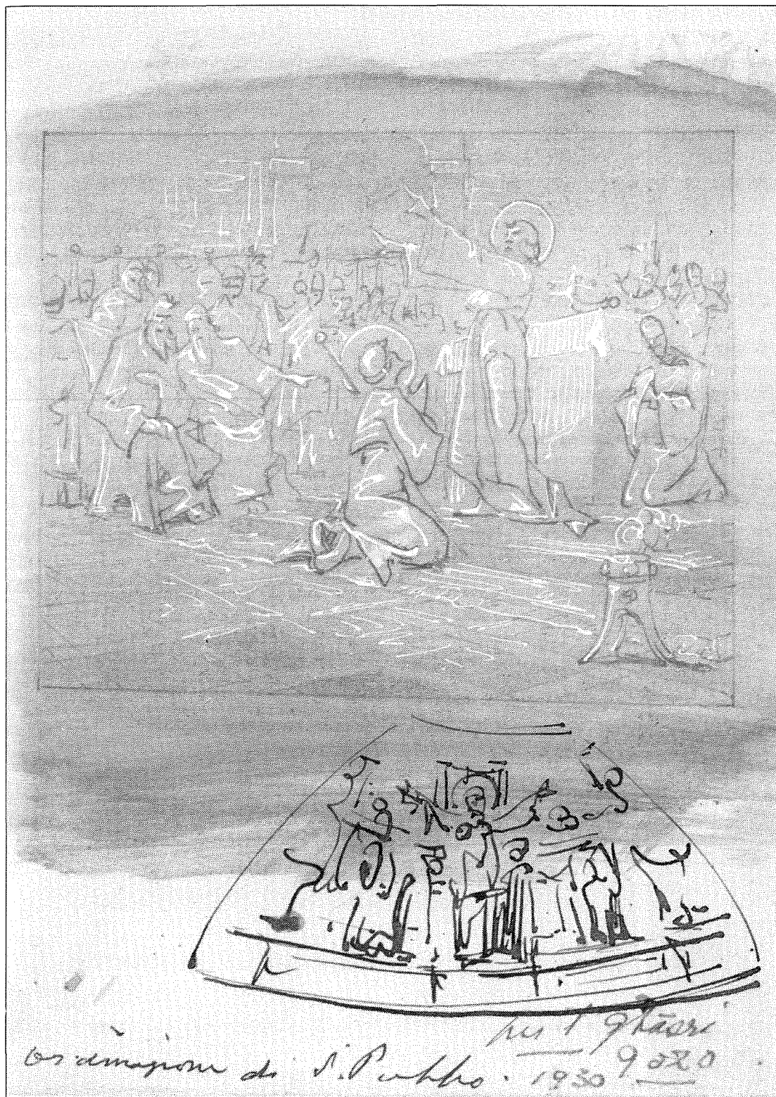
J. BRIFFA (1930), Skizz: L'Ordinazione di S. Publio per l'Ghasri – Gozo. 3