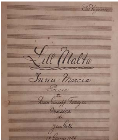
Qoxra tal-partitura tal-innu-marċ 'Lill Malta' (1926) ta' Mro Gatt

Għaqda Filarmonika 'Prince of Wales Own', Il-Birgu [1924-32]: Mro Gatt kien l-għaxar surmast wara Mro Aurelio Doncich (1865-1944). Għad li dwar haġtu u hidmietu ma tantx nafu, RMB 10 talanqas jgħarrafna bil-progress kbir li dil-banda kienet qiegħda tagħmel taht id-direzzjoni tiegħu. U bhala eżempju hu jgħib il-programm li kien sar is-Sibt, 5 ta' Mejju, 1926, imwettaq fi Pjazza Regina, li fih indaqqew dax-xogħlijiet, hafna minnhom traskrizzjonijiet għall-banda minnu stess (fejn hemm immarkati bl-istilla [*] warajhom): Marcia, isimha mhux magħruf, ta' Mro Gatt stess; Sinfonia 'Unfinished' (Schubert); Fantasia 'Tosca' (Puccini); Intermezzo 'Amor Fatale'* (Vassallo); Grand Selection 'Lohengrin' (Wagner); Danza 'Ondine Loreley' (Catalani); 'Karmesse Flemande' 11* (Von Goel 12 ); 'Mediation'* (Gillet); 'Suite Tzigane'* (Gracey).