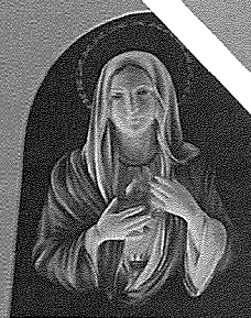
MADONNA TAD-DMUGH ITLOB GHALINA