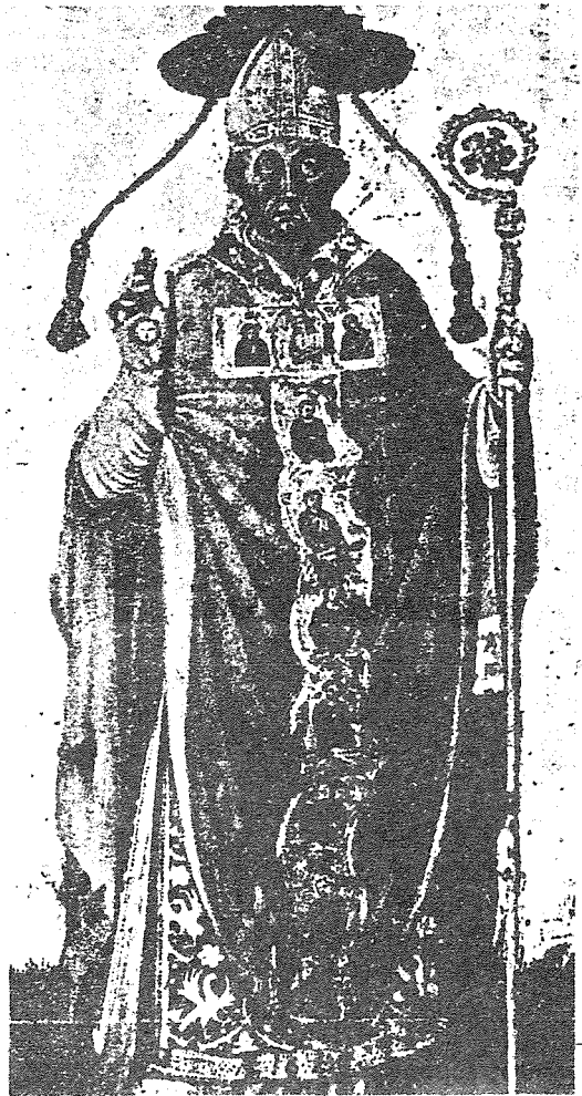
San Pier Damiani

Il-marjoloġija ta’ San Pier Damiani nsibuha l-iktar fiż-żewġ priedki tiegħu dwar in-natività, f’xi siltiet minn priedki oħra, f’xi whud mit-trattati qosra tiegħu, u anke fl-innijiet u fit-talbiet tiegħu lill-Madonna.