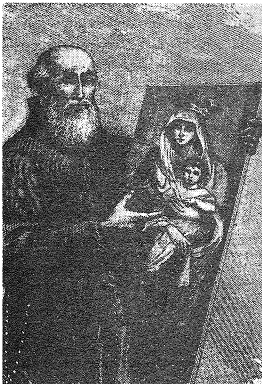
Patri Ġlormu minn Forlì