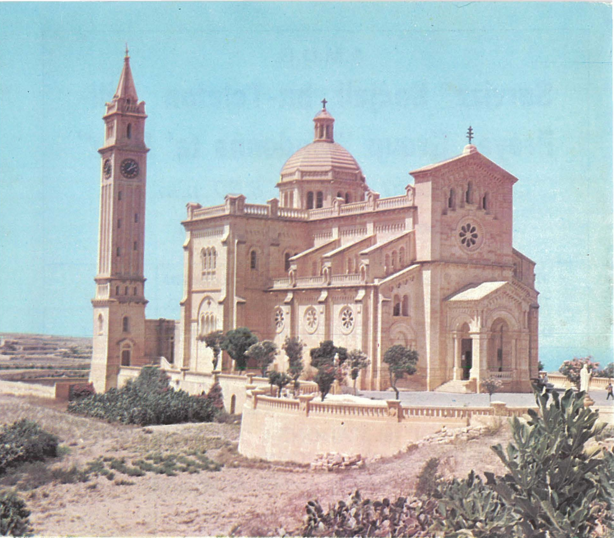
IS-SANTWARJU TA' PINU MIBNI WARA LI L-MADONNA KELI-MET LIL KARMNI GRIMA.

"Il-Verġni Marija li mit-tħabbira tal-Anġlu laqgħet f'qalbha u f'ġisimha l-Verb t'Alla u ġabet il-ħajja lid-dinja, hu magħrufa u unurata bhala vera omm ta' Alla u tar-Redentur. Hi stess meħlusa b'mod sublimi, in vista tal-merti ta' Binha u Mieghu marbuta minn rabta iebesha li ma tinħallx, hi mgħonija b'uffiċċju l-aktar għoli u bid-dinjità ta' Omm tal-Iben t'Alla, u għalhekk bint maħbuba tal-Missier u tempju tal-Ispirtu s-Santu: u li minħabba dan id-don tal-grazzja l-aktar għolja tisboq b'mod kbir lill-kreaturi l-oħra kollha fis-sema u fl-art. Hi madankollu marbuta flimkien mar-razza ta' Adam mal-bnedmin kollha fi hteieġa tal-fidwa, anzi hi "tassew omm tal-membri (ta' Kristu) ...għaliex ikkooperat bl-imħabba għat-twelid tal-fidili tal-Knisja, li ta' dak ir-Ras huma membri". Għal dan hi magħrufa wkoll bhala l-membri singolari u ewlenija tal-Knisja u figura tagħha u mudell l-aktar perfett ta' fidi u ta' karità, u l-Knisja Kattolika, mgħallma mill-Ispirtu s-Santu bl-imħabba ta' pietà ta' bint tiuveneraha bhala Omm l-aktar maħbuba".