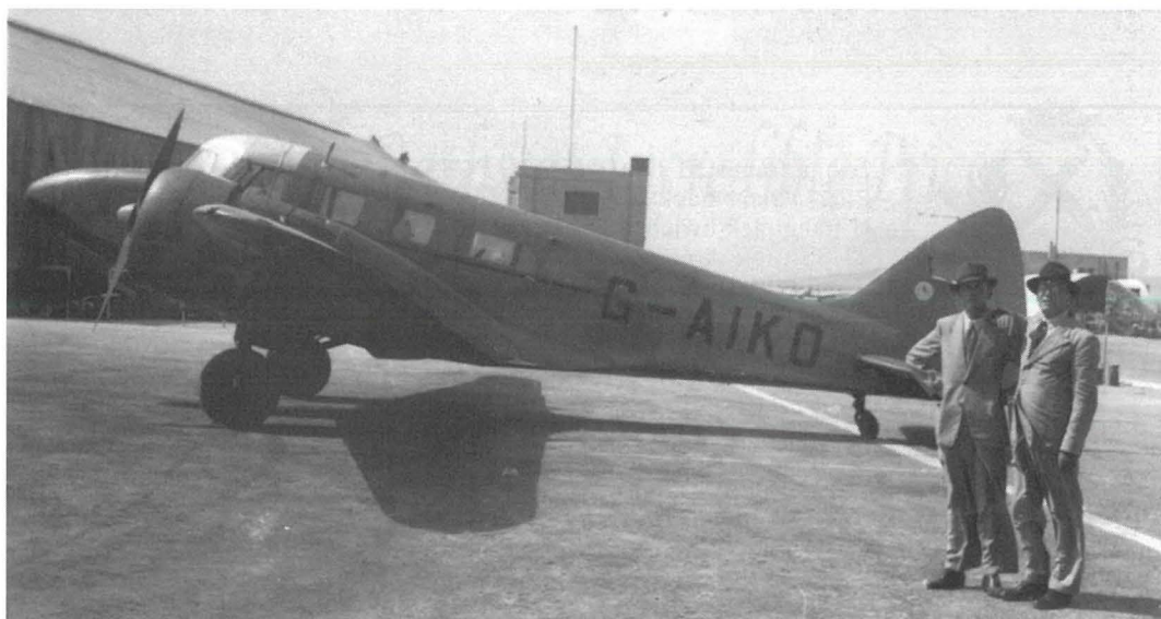
Airspeed Consul G-AIKO fl-ajruport ta' Hal Luqa qabel titjira għat-Tunisija. Dan l-ajru-plan baqa' jintuża mill-Air Malta sa Diċembru 1950

Vickers Viking, titjira li kienet tiehu kważi seba' siegħat u nofs. Fit-12 ta' Lulju 1948 kienet l-Alitalia li bdiet topera minn Malta, bl-użu ta' Fiat G.12, lejn Katanja u Ruma. 2