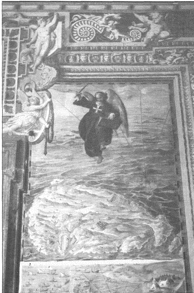
Parti mill-mappa li tinsab fil-Mużew tal-Vatikan

Vatikan nsibu l-pittura tal-mappa tal-Gzejjer Maltin fi żmien l-Assedju l-Kbir ta' l-1565 u jindika biċ-ċar li fil-Qala kien hemm ġnien kbir li kien imnizzel