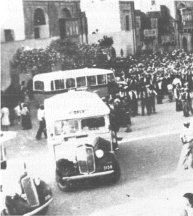
Il-Karozza tal-linja tal-Qala, Ritratt meħud fl-1935 fil-Pjazza ewlenija tax-Xaghra.

Bus Terminus. Minn hawn nitilqu: tfajliet għall-iskola li kienet dar fit-Triq it-Tigrija (illum hija Triq ir-Repubblika) hdejn l-Għassa tal-Pulizija; tas-Seminarju kien ikollhom xi kamra, biex joqogħdu fiha fil-brejk ta' nofsinhar; ahna dak iż-żmien skola san-nofs siegħa u s-Sibt ukoll biex ikollna żmien nistudjaw fid-dawl tax-xemx - għax imbagħad bil-lampa tal-pitrolju. U ahna s-subien? Għall-pjazza tat-Tokk. Niltaqgħu minn kull rokna t'Għawdex, bil-qiegħda fuq xi bank, nithadtu u nqabblu l-homework. X'hin joqrob il-hin, minn hemm nitilqu għas-suq, quddiem San Ġorġ għal Triq il-Karita' fejn wara San Ġorġ, qrib il-Vajringa go pjazzetta kien hemm l-iskola - il-Liceo - dar komuni. U meta tkun ix-xita jew hafna bard? Nibqgħu sejrjn u nieqfu għand Ġogo tal-kotba. Ġogo Pace kien ibiġh il-kotba u kellu speci ta' stationary. Kien idahħalna bil-qalb, għax kulhadd jixtri xi haġa: xi tokka, xi lapes, riga, pitazz: il-kotba fil-bidu tas-sena. U hekk wasalna l-iskola. Nisthajjilkom tghidu "tokka" x'inh? Il-Pinna: lasta tal-injam, daqs lapes, pennina (pinna) imwahħla fiha, inbilluha fil-klamar bl-linka u niktbu. Il-biros ma kinux jezistu dak inhar u biex ikollok fountain pen, trid tkun ilhaqt xi haġa!