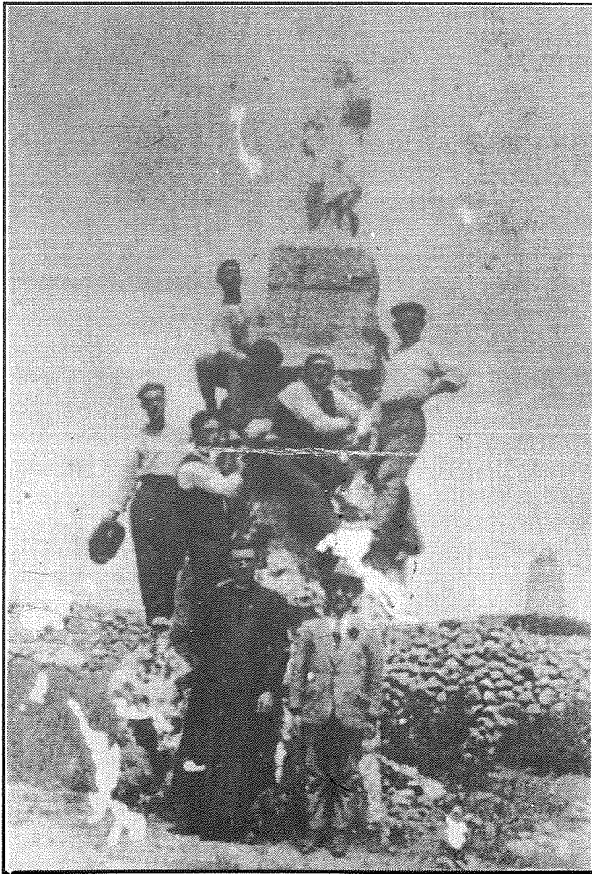
Il-ġebbla l-Wieqfa bl-istatwa ta' San Ġużepp fuqha u mdawwra b'għadd kbir ta' Qalin

D iffiċli timmagina kif kien ir-raħal tagħna madwar 5000 sena ilu. Pero' nistgħu nippruvaw xorta. Żgur li ma kienx hemm id-djar u l-bini kollu li hemm illum, jew it-toroq, jew il-knejjes u l-monumenti kontemporanji li jsebbħu l-istorja moderna tal-Qala. Pero' żgur li fil-Qala kien hemm numru mdaqqas ta' nies jgħixu. Kienet il-Qala ta' ġonna kbar, mimlija siġar, l-għelieqi b'hitan tas-sejjeħ jew żonqri fi stat ħafna aħjar minn tal-lum. L-għoljiet kienu ddominati minn gruppi żgħar ta' nies ġeneralment ta' familji li kienu jgħixu fl-