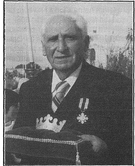
L-awtur li kellu l-unur li jgħorr il-kuruna li biha giet inkurunata x-xbiha ta' Santa Marija tal-Qala