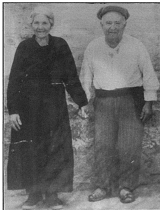
Il-Bużnanniet tiegħi fl-ilbies tipiku tad-dar. Innottaw it-terħa flok iċ-ċintorin.