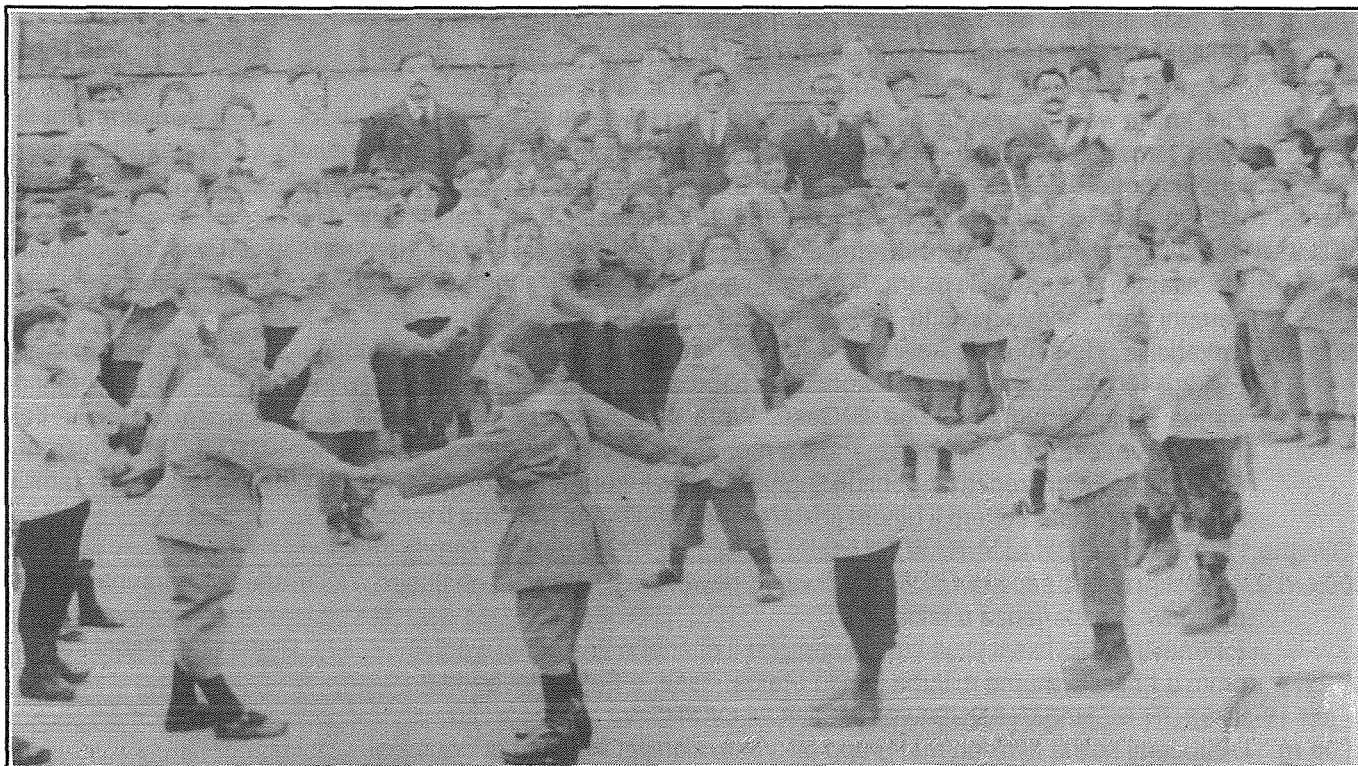
Tfal bl-uniformi tax-Xitwa ta' l-Iskola waqt il-hin tal-loghob flimkien ma l-ghalliema taghom

It-Tfal. It-tfulija ta' dari f'dak li ghandu x'jaqsam ma' hwejjeg kienet kwazi non-ezistenti. Ghalhekk kienu jlibbsuhom ilbies ta' l-adulti bhalma naraw fir-ritratt mehud f'Jannar tal-1916 fl-iskola tal-Qala. Bdil fil-kostum kien isir biss f'xi okkazzjoni speċjali bhal l-ewwel Tqarbina jew il-Grizma tal-Isqof kif nistghu naraw fil-ritratt ta' grupp ta' tfal li ghadhom kemm ghamlu l-Grizma. X'moda dik...qalziet qasir u tidher kbir ta' hames snin! X'sempliċita'! X'innocenza! O Żmien helu ... fejn int?