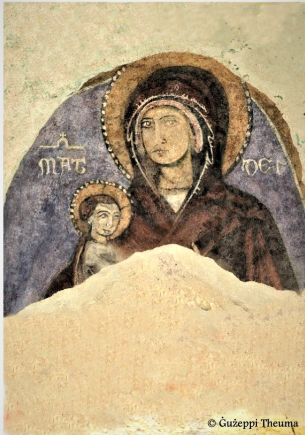
Il-Madonna bil-Bambin Pittur mhux magħruf Kappella Tal-Vitoria (Santwarju) - Mellieħa