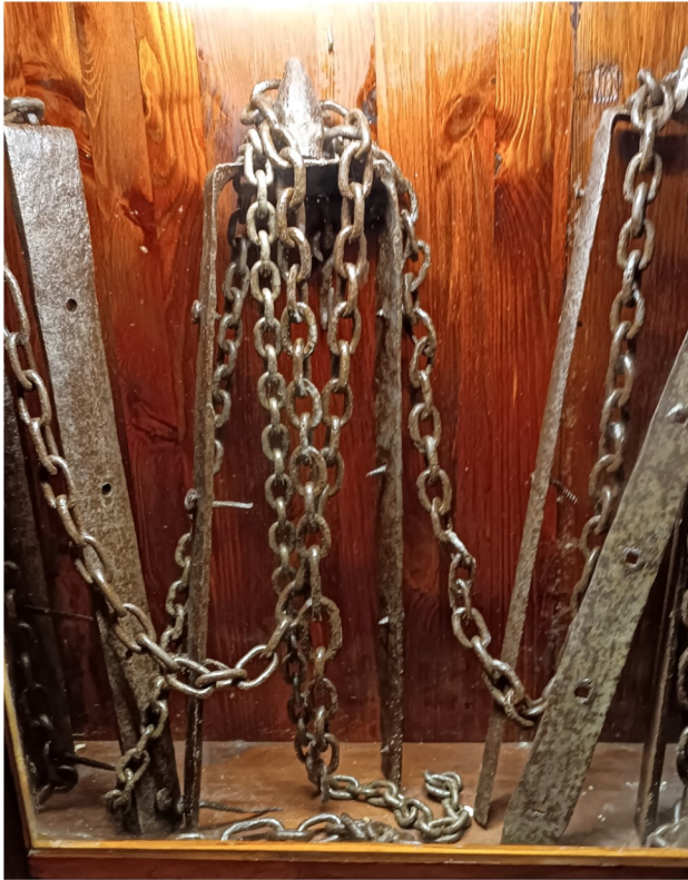
Ktajjen li kienu jintużaw mill-iskjavi