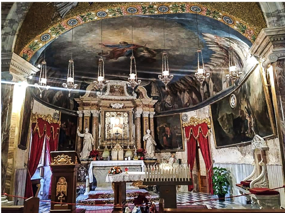
L-altar ewlieni fejn jidher is-saqaf impitter li juri l-Missier Etern