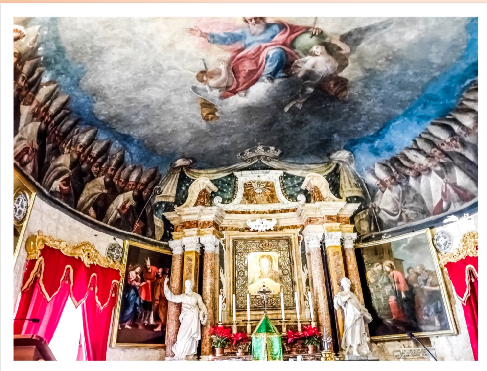
is-saqaf impitter li juri l-Missier Etern u numru ta' Isqfijiet

Fl-1436 meta l-Isqof Senatore de Mello semmgħa l-għaxar parroċċi tal-kampanja li kienu jeżistu f'dak il-perjodu, il-Mellieħa kienet waħda minnhom. Għalhekk f'din il-knisja twaqqfet il-parroċċa tal-Mellieħa li kellha t-truf tagħha sal-Mosta. F'dawk iż-żmienijiet il-gzejjer Maltin kienu ta' sikwit jiġu attakkati mill-pirati ta' Barbarija u mit-Torok. Il-Mellieħa messha sehemha wkoll minn dan il-flaġell.