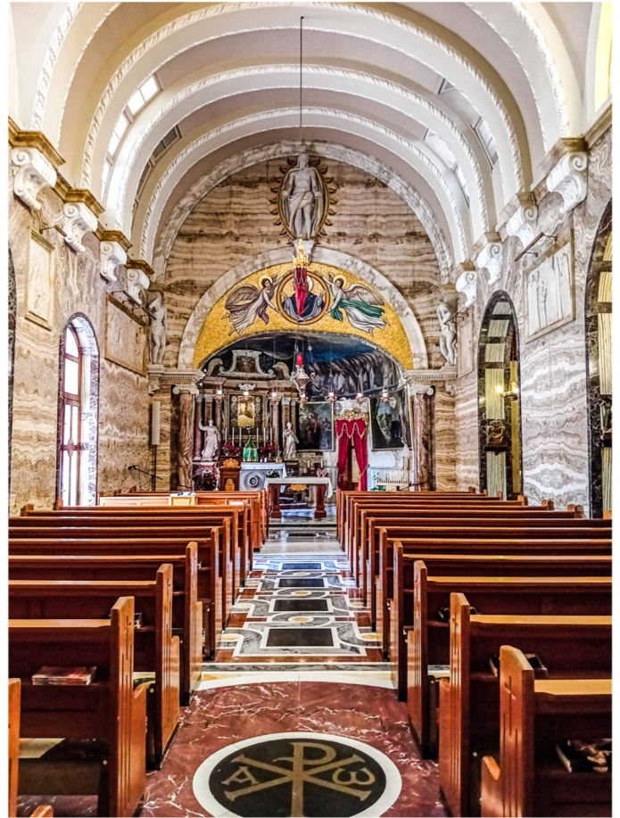
Harsa minn wara tas-Santwarju

Biex tasal għas-santwarju trid tgħaddi minn taht arkata bi grada kbira tal-ħadid iddisinjat. Fuq din l-arkata verament sabiħa hemm il-kliem bil-Latin u bil-Malti antik " Fik temgħu missirijietna, temgħu fik u inti smajthom " u tidher id-data ta' meta sar, jgħifieri dik tal-1719. Minn hemmhekk tidhol f'bitħa kbira u fil-ġenb hemm bibien biex tidhol fis-Santwarju. Faċċata tal-arkata hemm tlett loġoġ li kienu jservu ta' kenn għall-pellegrini. Fuq waħda minn dawn il-loġoġ jidher arloġġ tax-xemx. Mal-ħajt tas-santwarju tidher niċċa bi statwa kbira ta' San Pawl u fin-nofs tal-bitħa hemm statwa tal-Madonna. Jekk taqşam il-bitħa u tgħaddi minn taht il-loġġa u ddu fuq ix-xellug issib