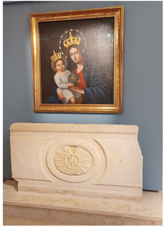
Pittura tal-Madonna bl-istellarju u nkurunata, bil-Bambin inkurunat iżomm il-globu f'idejh

il-mużew sar f'Diċembru 2023 mill-Isqof Awziljarju Joseph Galea Curmi. Sar xogħol verament professjonali, u wieħed m'għandux jitlef iċ-ċans li jżur dan il-mużew sabiex japprezza aktar il-wirt kulturali reliġjuż li ħallewna missierijetna.