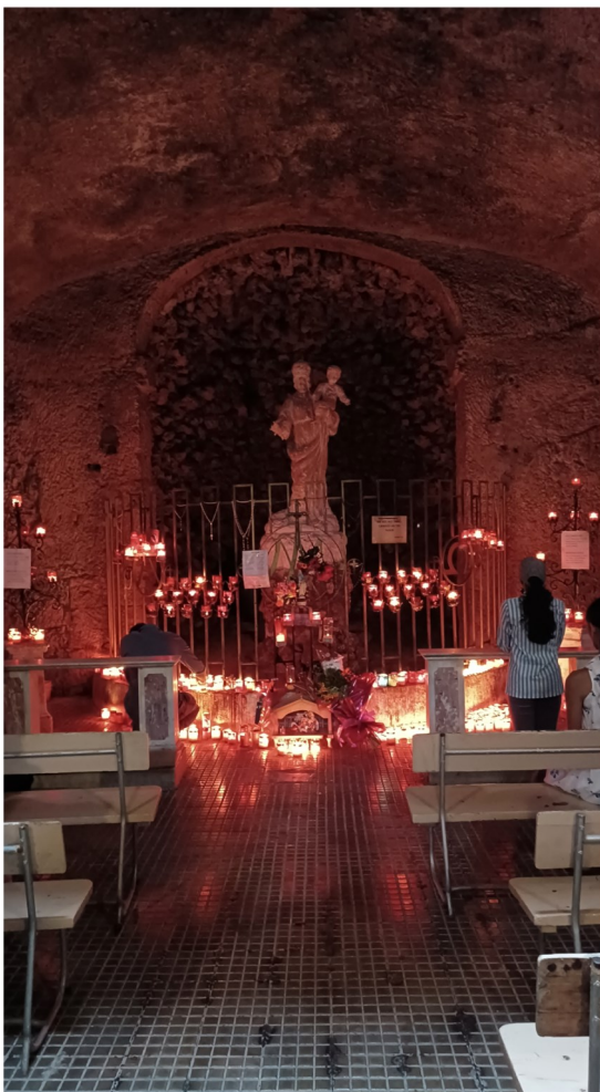
Dehra tas-għar minn ġewwa