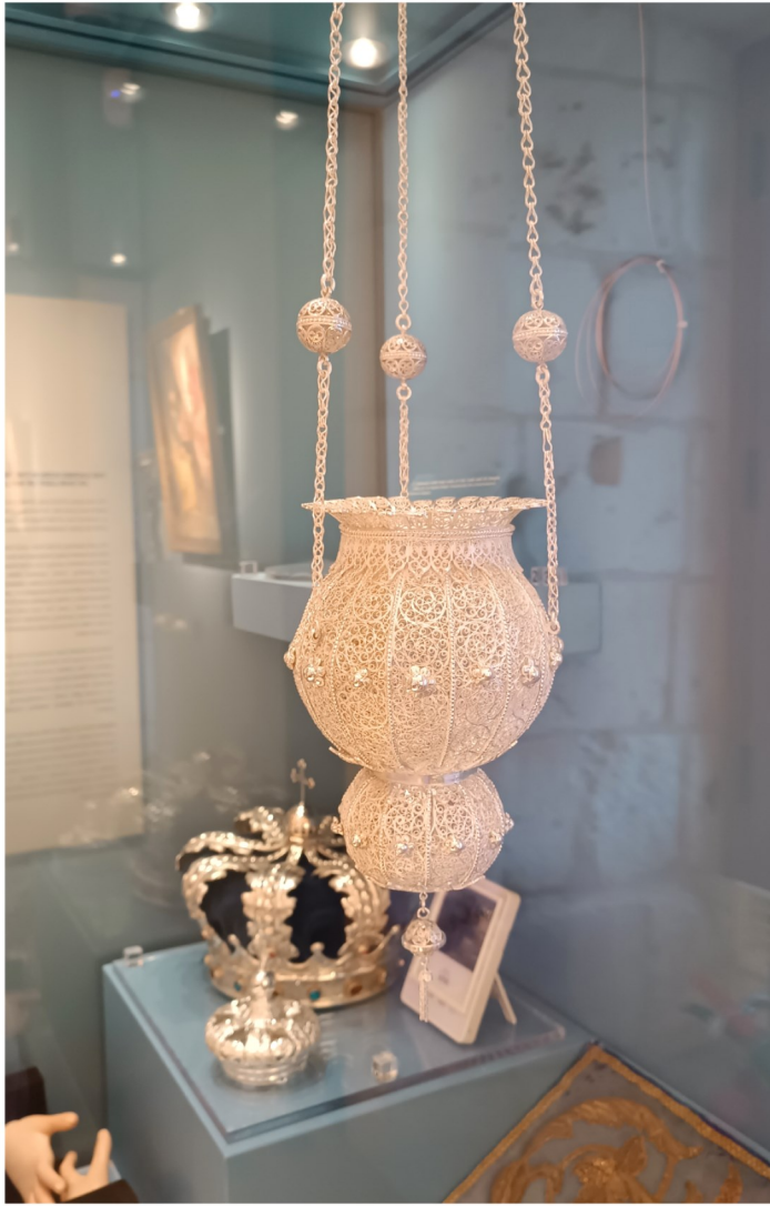
Lampier tal-fidda maħdum fil-filigranu, li skont in-notamenti huwa tas-seklu 17