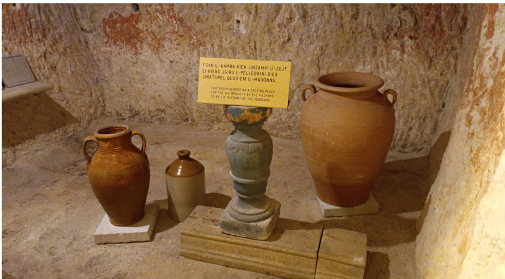
Il-kamra fejn kien jinżamm iż-żejt li kienu jieħdu l-pellegrini biex jinxtgħel quddiem il-Madonna

Fost ħafna persuni distinti li żaru lil dan is-Santwarju insibu lil Papa Ġwanni Pawlu II li mar iżur il-Madonna tal-Mellieħa nhar is-Sibt, 26 ta' Mejju 1990 fl-ewwel żjara tiegħu f'pajjiżna.