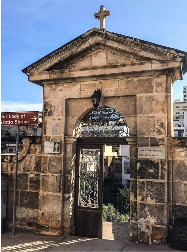
Daħla mit-triq għall-għar

de Vasi ħallas għat-tqattieħ fil-blat wara l-ikona tal-Madonna fis-Santwarju bħala sagristija żgħira. Xi uħud jgħidu li ħallas ukoll għar-restawr tal-pittura tas-saqaf fis-Santwarju li turi lil Missier Etern ma' numru ta' Isqfijiet, li skont it-traduzzjoni dawn għaddew Malta fi triqthom lejn il-Koncilju ta' Milevio, qrib Kartagni fis-seklu 5 WK, liema Koncilju kien invokat mill-Papa Innocent I fi żmien Santu Wistin, u bierku u kkonsagraw dan is-Santwarju.