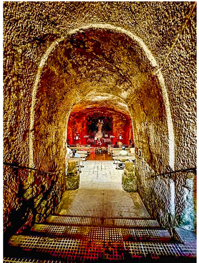
Dehra tal-għar mid-daħla