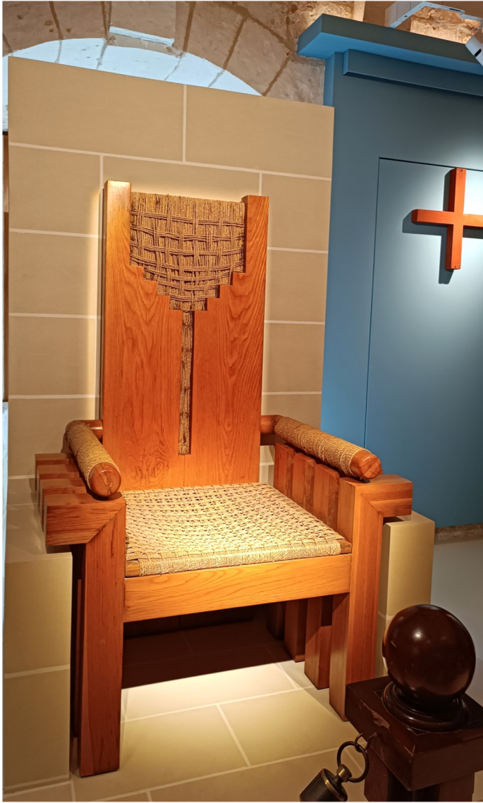
Is-sigġu li poġġa fuqu il-Papa Ġwanni Pawlu II meta żar Malta

tas-Santwarju bena kwartieri kemm għalih kif ukoll kmamar li servew ta' post ta' serħan, fuq żewġ sulari b'disat ikmamar. Filwaqt li l-ewwel sular inbena fis-16-il seklu, dak ta' fuq inbena matul it-18-il seklu.