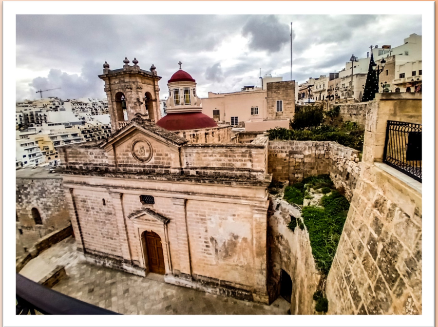
Il-faċċata tas-Santwarju mill-għoli

Dejjem skont l-istess tradizzjoni, li mhux kulħadd jaqbel magħha, ix-xbieħa li hemm fl-għar tal-Mellieħa tpittret fuq il-blat minn San Luqa. Dan San Luqa kien dixxiplu ta' San Pawl u kien qed jivjaġġa miegħu, meta l-Mulej wassalhom fostna. Bla dubju din ix-xbieħa hija mirakoluħa, kif jixhdu l-għadd kbir ta' kwadri ex voto u għotjiet oħra mħollija b'radd il-ħajr.