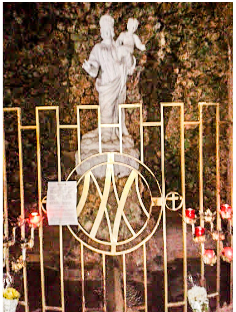
L-istatwa tal-Madonna bil-Bambin

L-ewwel okkazzjoni kienet grat fit-2 t'Awwissu 1887 meta s-Suġent Maġġur Vittorio Gauci ddikkjara li ra l-id il-leminija tal-istatwa tal-Madonna tiċċaqlaq il-fuq u l-isfel fi tliett okkazzjonijiet differenti fl-istess ġurnata. L-istess ġara fit-13 t'Awwissu meta 10 persuni differenti raw l-istess fenomenu, filwaqt li żewġ persuni oħra, inkluż il-Kappillan tal-Mellieħa Dun Francesco Magri, għal darbtejn