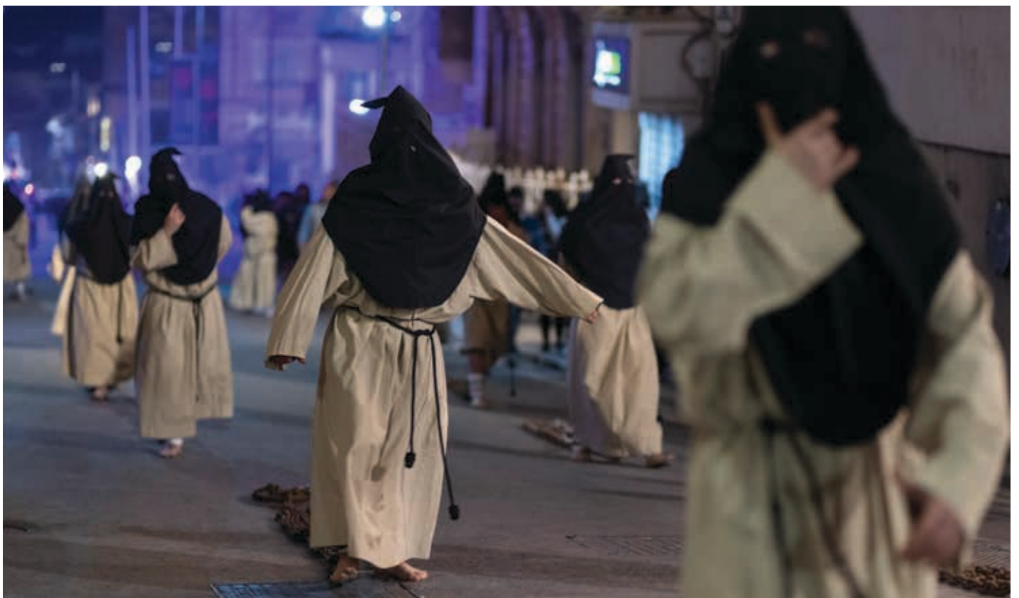
Wiċċhom mgħammda fit-Tiġrija: il-penitenti jkaxkru l-ktajjen warajhom waqt l-aħħar Purċissjoni tal-Ġimgħa l-Kbira.