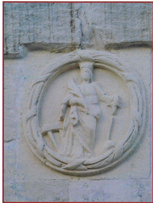
Dettal tal-Medaljun ta' Santa Katarina V.M

Il-Kappella ta' Santa Katarina V.M. li darba kienet imwaqqfa fil-limiti tal-Baqqari, tmur lura għas-seklu 13 (fil-perjodu A.D. 1200 – 1500) u hija l-akbar xhieda ta' dan. Bejn is-sekli 14 u 15 insibu li twaqqfu l-ewwel parroċċi f' Malta u dik taż-Żurrieq iddedikata lil Santa Katarina V.M. tkun fost dawn il-parroċċi ewlenin. Mal-medda tas-snin, f' kull grajja tal-Istorja ta' raħalna, il-poplu taż-Żurrieq minn dejjem ħabb u kellu devozzjoni lejn din il-qaddisa Katarina waqt li poġġieha l-protettriċi tiegħu. Il-Knisja ewlenija ta' raħalna, it-tempju Katarinjan, huwa monument ħaj tad-devozzjoni u huwa l-ogħla ġieħ ta' mħabba lejn Santa Katarina V.M. Estenzzjoni ta' din id-devozzjoni tal-poplu taż-Żurrieq lejn il-patrana tiegħu huma l-għadd ġmielu ta' niċeċ, vilistruni, armi, fontispizji bi xbiehat ta' Santa Katarina V.M. u emblemi tagħha mal-faċċati tad-djar tagħna.