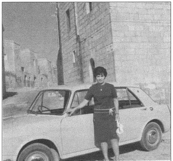
Ritratt tal-karozza l-ġdida li xtrat f'Awwissu tal-1968 fejn illum hemm ir-rawndabout ta' Patri Ġuzepp Portelli