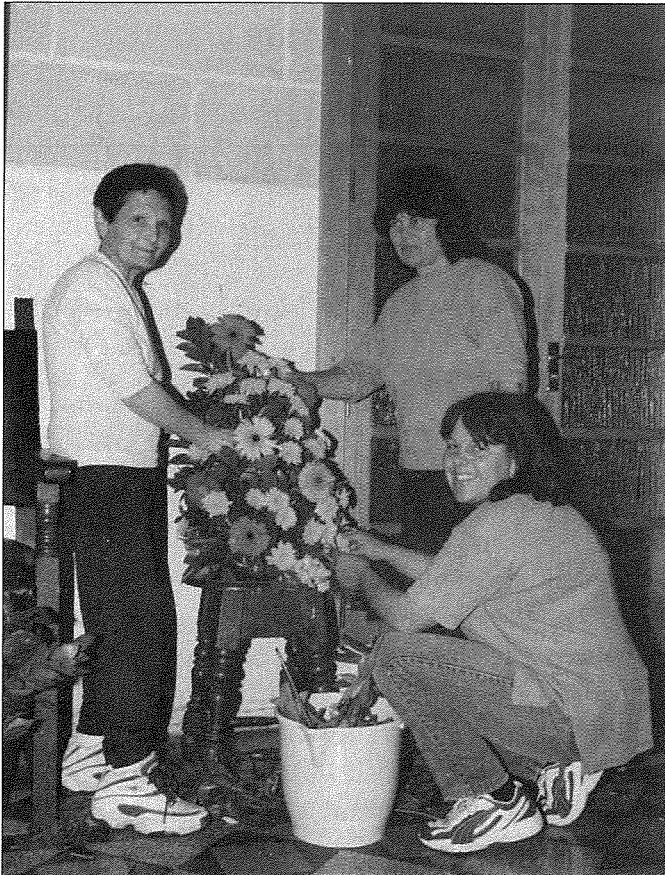
Nancy bdiet u mexxiet il-Grupp tal-Arranġamenti tal-Fjuri

thabbat bieb bieb tbiegħ il-biljetti tal-lotterja b'risq il-parroċċa, taħsel l-art tal-Knisja u aktar tard ta' 14-il sena bdiet tgħallem id-duttrina lit-tfal żgħar. Fiż-żmien l-Arċipriet Dun Ġużepp Borg Attard, apparti li tbiegħ il-biljetti tal-lotterija, tgħallem id-duttrina u tgħin fil-ħasil tal-art giet inkarigata wkoll li tieħu ħsieb it-trieħi fil-Knisja.