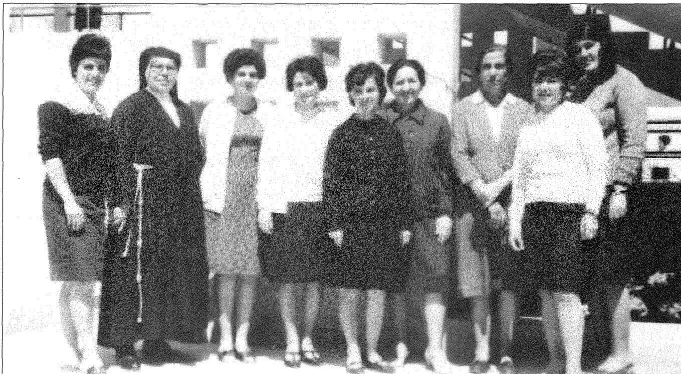
Ritratt tal-istaff tal-Iskola Primarja tal-Qala 1976