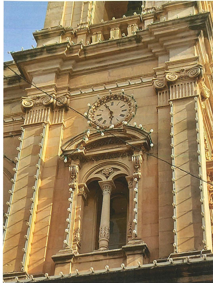
L-arloġġ fuq il-faċċata tal-knisja