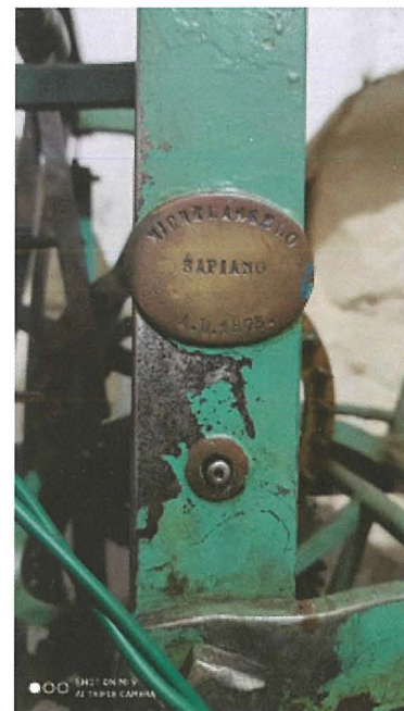
Il-makinarju tal-arloġġ fil-knisja ta` Stella Maris

Fost affarijiet oħra interessanti li vvinta, insibu arloġġ bil-mappa tad-dinja u li juri kull siegħa r-relazzjoni tad-dinja max-xemx, mizien ta` preċiżjoni kbira għad-dwana ta` Malta u diversi arloġġi bl-alarm. Is-Sočjeta` tal-Arti u Manifattura ppremjatu b`midalja tad-deheb. Il-fama tiegħu xterdet barra minn xtutna, tant li kien għamel arloġġ kbir għal knisja ta` Santa Katerina ta` Lixandra, ġewwa l-Eġittu.