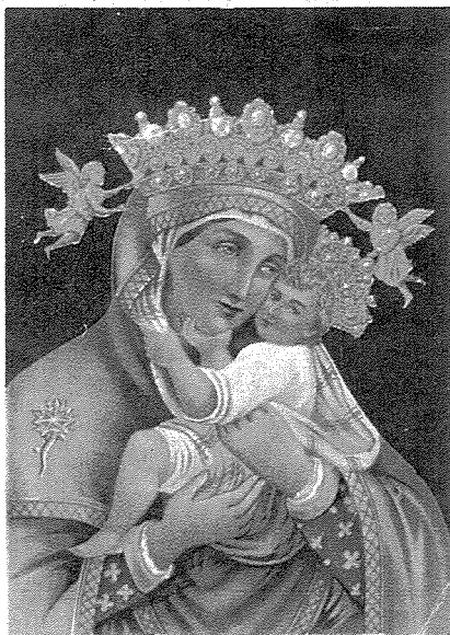
MARIA SS. DEL CARMINE

"Oh Beata Vergni Immakulata, dekorata bit-Titlu tal-Karmelu. Int li thares b'ghajn ta' tjubija lejn dawk li jilbsu l-Labtu li huwa