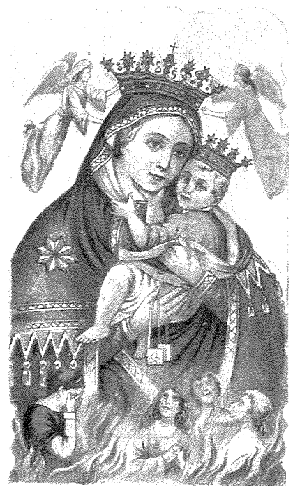
B. V. del Carmine

venerata nel Santuario del Carmine Maggiore di NAPOLI