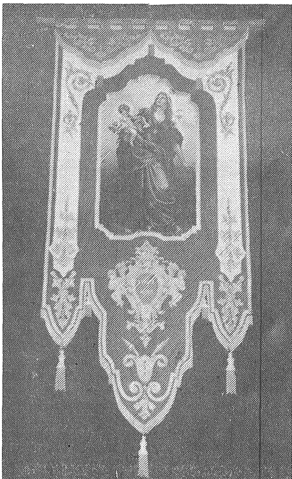
Wahda mill-banda'ori jodda li se jiżżanznu din is-sena.

Ma' dawn nistgħu nżidu wkoll li sa jitpoġġew sett ta' linef lejn l-inħawi ta' Savina, pavaljuni disinjati fit-triq tal-każin u affarijiet oħra li kolloxx ma' kolloxx żgur sa jkunu att-razzjoni għall-festa ta' Santa Marija ta' Għawdex ta' din is-sena.