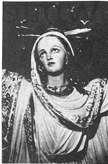
Antifona, Tantum Ergo u Trina Barka Sagramentali.