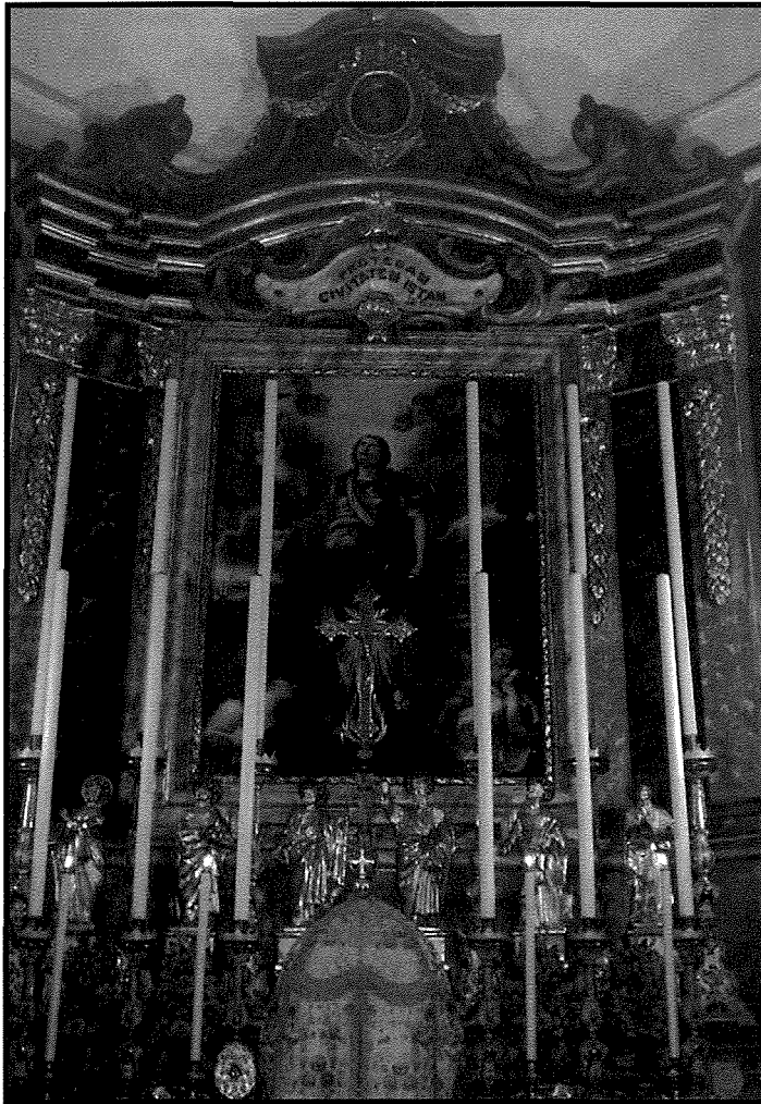
L-artal maġġur armat għall-festa fil-Knisja ta' San Ġiljan ta' l-Isla

Wara li fix-xhur ta' l-Assedju l-Kbir ta' l-1565 in-nies tal-belt il-ġdida ta' l-Isla kienu sabu kenn fit-talb taht is-saqaf ta' din il-knisja, fl-1575 waqt żjara tal-Viżitatur Appostoliku, Mons. Pietro Dusina ried li San Ġiljan issir Viċi-Parroċċa tal-Birgu meta l-Isla kienet taghmel ma' din il-parroċċa. Fil-mixja tas-snin f'din il-knisja, fl-1577 twaqfet il-Fratellanza tas-Santissimu Sacramento u sa mis-sena 1588 beda jsir ukoll it-tagħlim ta' edukazzjoni sekondarja minn Dun Vincenz Caruana li aktar tard sar Kappillan ta' l-Isla. Din hawn min iqis li kienet l-ewwel skola ta' l-ghamla tagħha f'Malta.