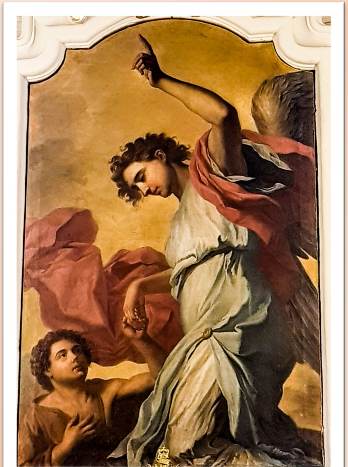
Ruħ tittelgħa mill-purgatorju ta' A de Favray