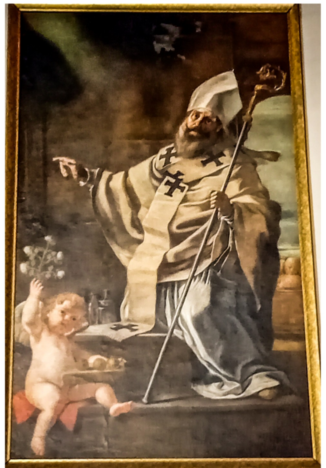
San Nikola ta' Mattia Preti

prospettiva sabiħa fi stil Barokk. Il-kwadru titulari, li sar fl-1678; l-erba' kwadri taħt it-twieqi u ż-żewġ lunetti kbar fuq il-bibien laterali, huma kollha xogħol tajjeb ta' Mattia Preti, speċjalment l-erba qaddisin: San Bastjan; Santa Rosalia; Santu Rokku u San Nikola Isqof, li huma meqjusa fost l-ifjen xogħol tiegħu f'Malta. Il-knisja min barra għandha dehra eleganti, simili għal dak ta' ġewwa, fejn jispikka l-lavur madwar il-bibien, li jinkludi fuq il-pediment nofs-tond miksur, kwadrant bl-istemmi doppji tal-Ordni. Il-koppla maestuża kellha oriġinarjament lanterna proporzjonata, li tneħħiet fis-seklu XIX.