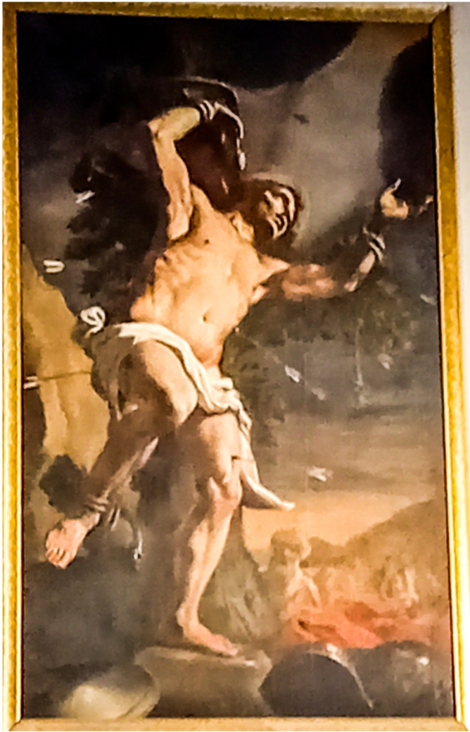
San Bastjan ta' Mattia Preti

Fl-1922 gie propost li l-knisja titmexxa mill-Giżwiti, pero din flimkien mad-dar, għadew f'idejhom ufficjalment fit-28 ta' Novermbu, 1924. Matul it-Tieni Gwerra Dinjija u ftit wara, minħabba li kienet iggarfet il-knisja parrokkjali ta' San Publiju, l-istess ħidma parrokkjali kienet issir min din il-knisja. Sa llum din għadha titmexxa mill-Giżwiti u fiha jsiru l-attivitajiet Liturġiċi regolarment.