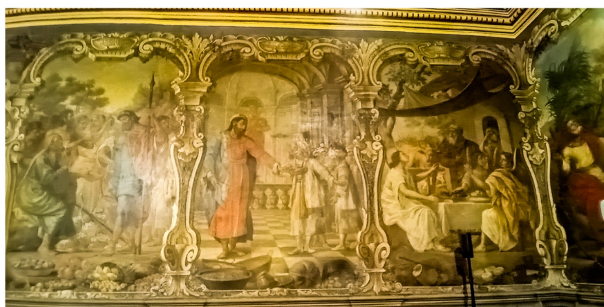
Parti mill-ħajt tar-Reflettorju