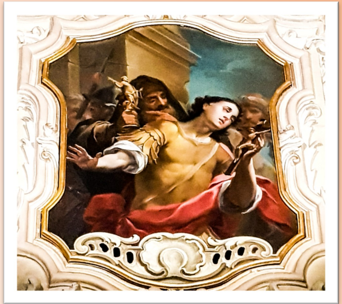
San Kalċedonju jirrifjuta li jadura l-allat foloz