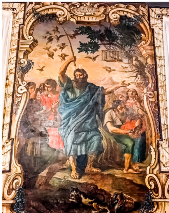
San Pawl jasal Malta fir-Reflettorju