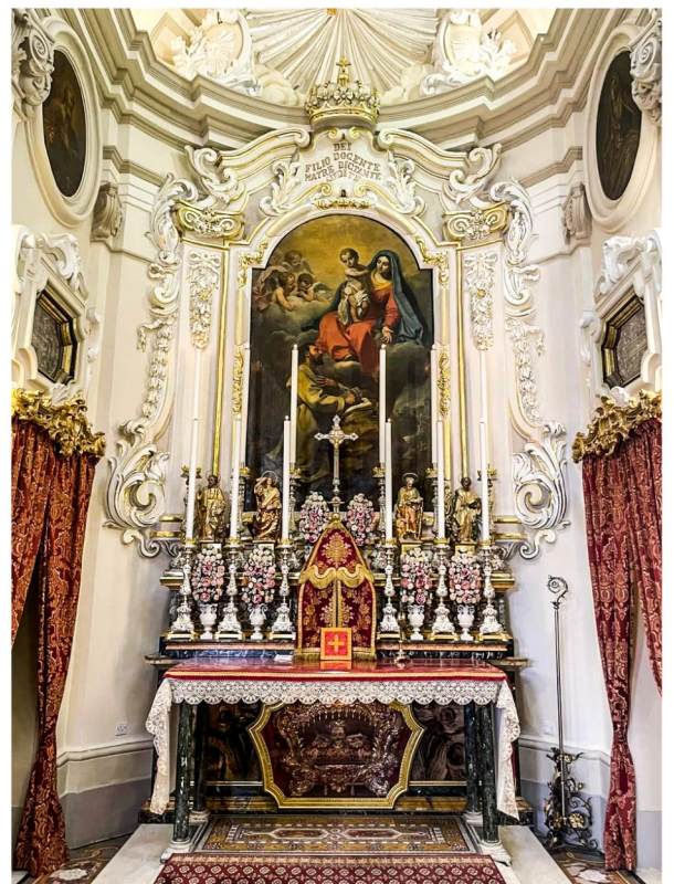
L-artal ewlieni tal-kappella tal-Madonna ta' Manresa

Il-kappella ġiet iddisinjata f'forma ovali li għal dak iż-żmien kienet unika. Wisq probabli li Andrea Belli kien influwenzat mid-disinn ta' Francesco de Volterra għall-kappella ta' San Giacomo degli Incurabili f'Ruma.