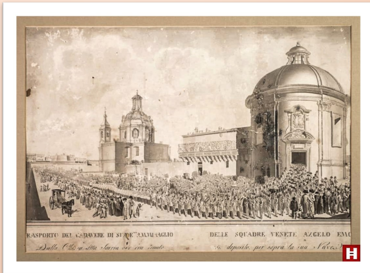
Inċizzjoni li turi il-knisja ta' Sarria u l-ewwel knisja ta' San Publju

Din hija t-tieni knisja mibnija fl-istess post, iddedikata lil Immakulat Konċepiment ta' Marija, fil- contrada Ghurardia . Kien il-Kavallier Fra Martino de Sarria Navarro li bnienha 'l barra mill-ħitan tal-Belt Valletta fl-1575, għalkemm il-bini kien ikkummissjonat bejn l-1571 u l-1574. Wara li miet il-fundatur, l-amministraturi tagħha kienu membri tal-Ordni ta' San Ġwann, li barra mill-knisja kellhom għad-dispozzjoni tagħhom dar bi ġnien hdejha. Kwadru li kien f'din il-knisja,