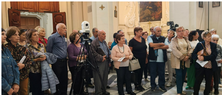
Membri tal-Għaqda fil-kappella tal-Madonna ta' Manresa fil-Kurja tal-Arcisqof