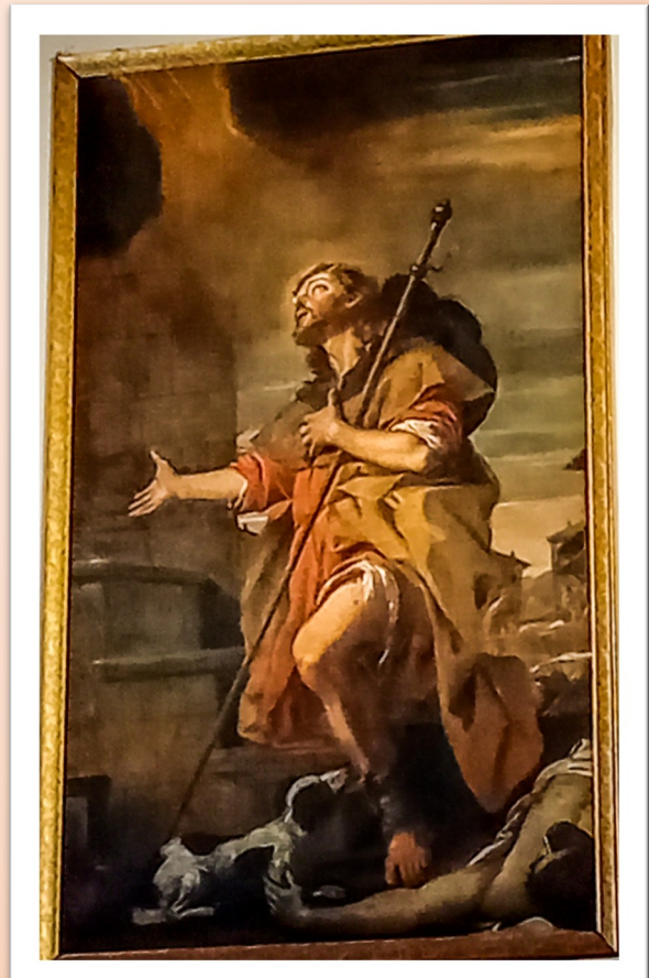
Santu Rokku ta' Mattia Preti