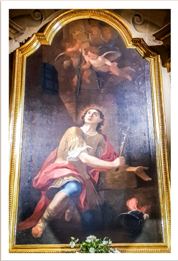
It-titular juri lil San Kalċedonju fil-ħabs

Fis-sena 1753 il-Papa Bendittu XIV, fuq talba ta' Fr Rosignoli, kien irregala il-korp sant ta' San Kalċedonju Martri, liema fdalijiet waslu fil-kappella fl-20 ta' Mejju ta' l-istess sena. Il-fdalijiet kienu ġew miċ-ċimiterju ta' Pretastato l-Italja. Maġenb il-kappella tal-Madonna ta' Manresa wieħed isib ukoll kappella verament żgħira imma ħelwa bi tliet biċċiet ta' pitturi ta' Francesco Zahra: it-titular li juri lil San Kalċedonju fil-ħabs; ieħor il-martirju tal-qaddies, u t-tielet wieħed juri li San Kalċedonju jirrifjuta li jadura l-allat foloz.