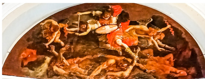
Lunetta li turi r-rebħa tar-religjon fuq it-Torok

Il-Gran Mastru Manuel De Vilhena, meta ra li madwar il-knisja bdiet tiżdied in-nies, talab biex din issir parroċċa. Dan sar permezz ta' supplika lis-Santa Sede fil-21 ta' Settembru tal-1724, pero d-deċizjoni tħalliet f'idejn l-Isqof ta' Malta, li min naħa tiegħu m'acċettax din il-proposta, għax din il-knisja ma kinitx taħt il-ġurisdizzjoni tiegħu. Din il-knisja wkoll kienet amministrata minn membri tal-Ordni, filwaqt li wara l-1798 bdew jieħdu ħsiebha qassisin djoċesani bħala retturi, għalkemm il-bini baqà propjeta' tal-Gvern.