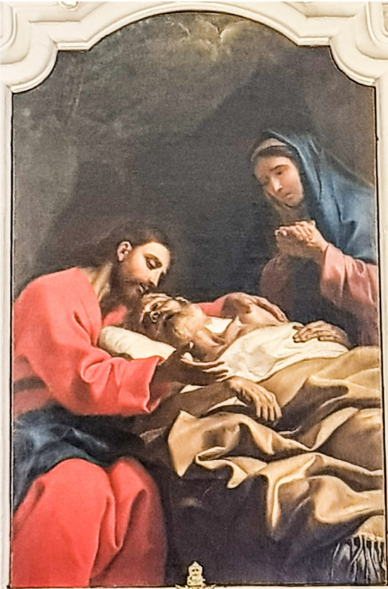
Mewt ta' San Ġuzepp ta' Antoine de Favray

Id-dekorazzjoni u x-xenografija tal-kappella u l-mod kif l-altar magħgur ġie spusstjat il-ġewwa jixbaħ ħafna ix-xogħol li għamel Cosmas Damian Assam fil-knisja tal-Abbazija ta' Weltenburg, fil-Bavaria, u f'kappelli oħra tas-seklu 18 fir-reġjuni ta' l-Awstrija u l-Bavarja.