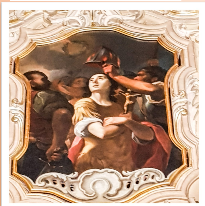
Martirju ta' San Kalċedonju