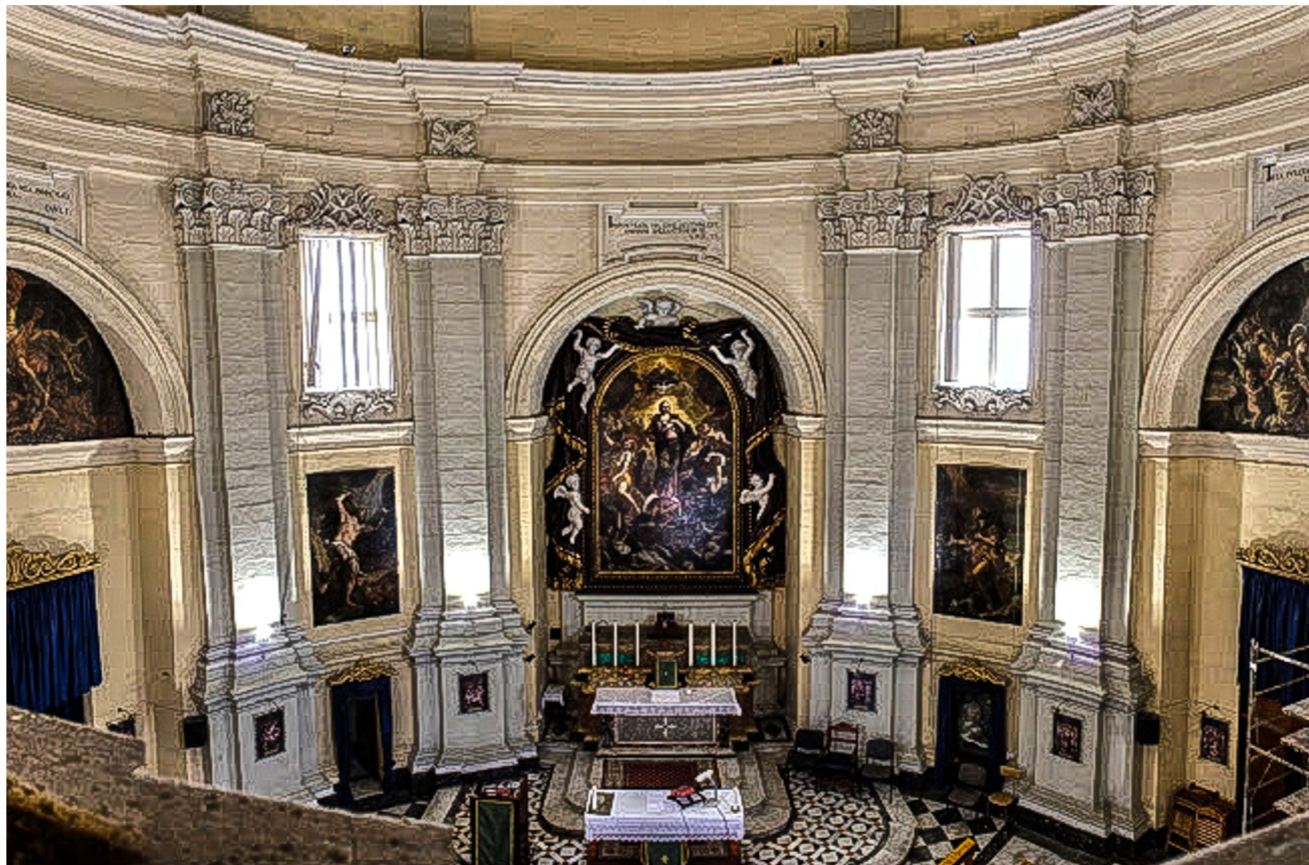
Ħarsea lejn l-artal maġġur mill-gallarija

L-ewwel ġebli tpoġġiet mill-Gran Mastru Cottoner nhar it-8 ta' Diċembru 1676 u kienet lesta u miftuħa sal-1679. Il-pjanta saret mill-artist Mattia Preti li kien anke ppreżenta lil Kunsill tal-Ordni b'mudell tal-knisja, li ġie approvat fis-27 ta' Mejju tal-1676, pero hemm possibilita' li waqt il-bini kien assistit ukoll minn Lorenzo Gafà għal parti teknika.