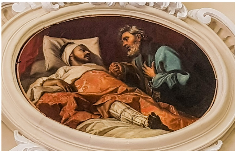
Konverzjoni ta' San Injazju marid fis-sodda

oħra għal din il-kappella. Pittura oħra turi liż-żewġ qaddisin patrni kemm ta' Malta kif ukoll tal-Ordni, San Pawl u San Ġwann il-Battista. Il-ċiklu jkompli bil-mewt ta' San Ġuzepp, li taffigura b'mod preċiż mewt qaddisa, billi San Ġuzepp għandu madwaru lil Ġesu u lil Marija. Pittura oħra turi l-mewt ta' San Franġisk Saverju, li kien wieħed mill-akbar missjunarji tal-Knisja u li kien kontemporanju ta' San Ignazju. Iċ-ċiklu jispiċċa b'pittura ta' ruħ imtella mill-purgatorju. Fl-aħħar wieħed jara żewġ pitturi ovali ddedikati lil San Injazju, waħda qed iqassam il-ġid tiegħu u l-oħra fuq is-sodda tal-mewt.