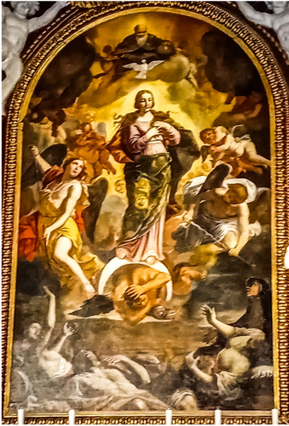
It-titular li juri lill-Immakulata Kuncizzjoni wkoll kapulavur fil-gebla tal-istess artist.

It-titular ta' din il-knisja huwa biċċa mill-isbaħ, xogħol tal-Kalabriż Mattia Preti li juri lill-Immakulata Kuncizzjoni mal-aṅgli li qed iqiegħdu x-xwabel lura fl-għant tagħhom wara li kienu għadhom kemm kemm użawhom biex rebħu fuq il-pesta.