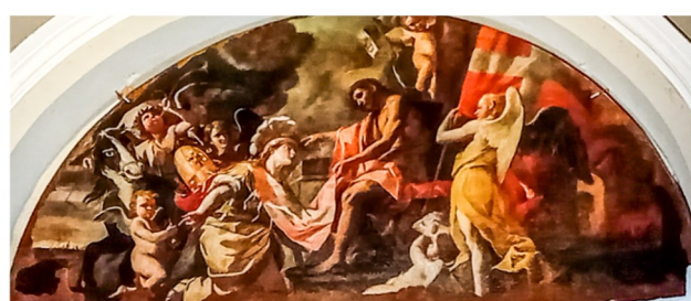
Lunetta li turi l-abitu tal-ordni Ġerosolomitan