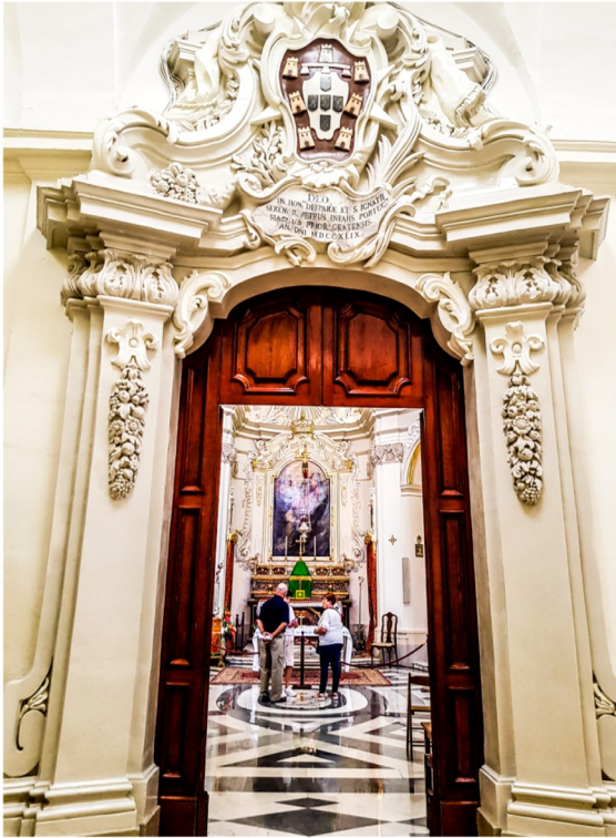
Daħla għal kappella tal-Madonna ta' Manresa