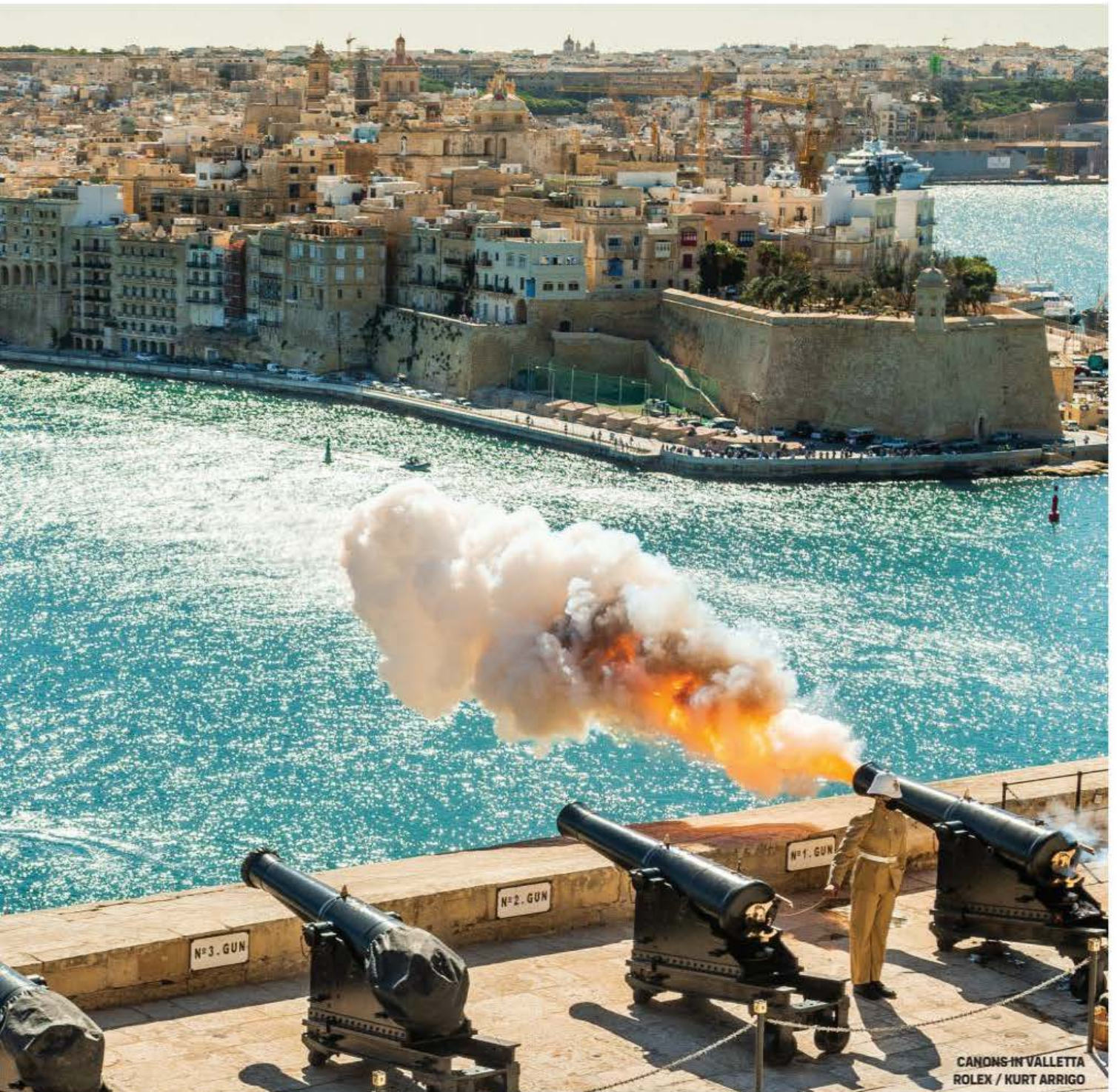
CANNONS IN VALLETTA