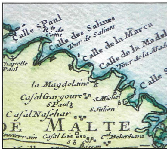
Dettall ta' mappa tal-imghoddi li turi l-inhawwi ta' Casal Nasehar.