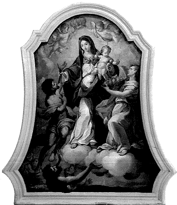
L-inkwatra ż-żgħir tal-Madonna tad-Dawl, impittr minn Francesco Zahra.

mqieghed mill-ewwel fil-knisja għall-qima tan-nies). Għall-habta tal-1773 in-Naxxarin bdew jaħsbu biex jippreparawlu post proprju fil-kappella tad-Duluri. L-altar sar tal-irham u saret urna mzejna tajjeb minn ġewwa, bil-ħgieg mal-ġnub, u kancell tal-hadid indurat bid-deheb fuq quddiem. Meta mbagħad, fl-1787, saret il-festa kbira meta wasal dan il-ġisem qaddis fil-knisja tan-Naxxar, 9 dan tpoġġa fl-urna li kienet tlestiet għalih.