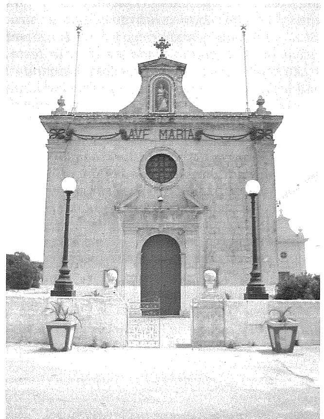
Il-knisja tal-Kunċizzjoni, il-Qala, fejn hemm il-qabar ta' San Karrew

Id-dqiq kienu jeħduh għand tal-forn, iferrgħuh ġol-lembija, iħalltulu naqra ħmira miegħu u jagħgħnuh. Wara jgħattuh biex bisshana jitla' u mbagħad iqattgħuh hobża hobża