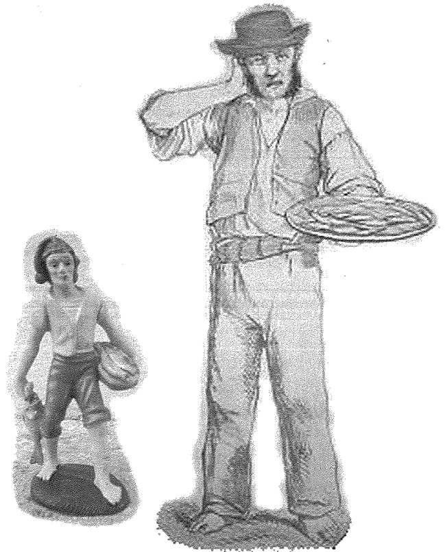
Il-bejtiegħ tal-ħut, persunaġġ li sab post ukoll fil-presepu tradizzjonali Malti

L-iktar ikla komuni ta' kuljum kienet aktarx il-minestra li xi rġiel kienu jieklu mhux minn ġo platt iżda minn ġo žingla žġħira. Stuffat tal-fenek jew xi tiġieġa jew serduq kienu jiħhallow għal nhar ta' Hadd jew nhar ta' festa, li dari kien hawn ħafna iktar festi kkmandati mil-lum. Xi kawrata bil-majjal jew xi platt kirxa ma kienux jonqsu, u l-anqas xi borma ravjul, meta tqis li kwaži kulħadd kien irabbi xi nagħa jew tnejn għall-ġbejniet kif ukoll xi žewġ tużżani tiġieġ ġol-biħħa. It-tiġieġ kienu jkunu minn tagħhom stess billi kienu jpoġġu l-qrajjaq. Għalhekk ħafna nies kienu jfittxu l-bajd tas-serduq għall-qroqqa u min kien ikollu s-serduq ta' tużżana bajd kien jiġbor tlettax. (1) Id-dar tagħna t-tiġieġ kienu jkunu merħijin il-Wied u mhux darba jew tnejn li telgħet qroqqa bil-flieles warajha. Meta ommi ma kenitx tkun taf fejn kien ikun il-maqgħad tal-bajd, kienet torbot ġolġol ma' sieq il-qroqqa u toqgħod tissemmalha biex tara fejn sa tidħol. Dejjem sabiħa l-bejta! Meta tiġieġa ma kenitx tkun tista' tbid il-bajda, kienu jgħidu "għandha l-bajda mdawra", imbagħad kienu jpoġġuha ġo xkora u jgerrbuha t-taraġ. Ma nistax ngħid jekk din l-operazzjoni kenitx tirnexxi. Povra tiġieġa: dejjem setgħet issir brodu!