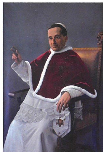
Il-Papa Benedittu XV

L-istess kanċillier tal-Isqof f'ittra ddatata 20 ta' Mejju lill-Arċipriet jistqarr li baqa' mistgħaġeb li d-deċiżjoni ttieħdet daqshekk malajr. L-aħbar inqat pubblikament lill-poplu tal-Belt Senglea nhar it-23 ta' Mejju filgħaxija, waqt ċerimonja li saret wara l-kumpieta li għaliha kien mistieden l-Isqof li kien strumentali biex seta' jingħata dan il-privileġġ. Sena wara, fl-4 ta' Settembru 1921, il-Bambina tal-Vittorja saret l-ewwel statwa f'Malta li ġiet inkurunata solennement bl-approvazzjoni tas-Santa Sede.