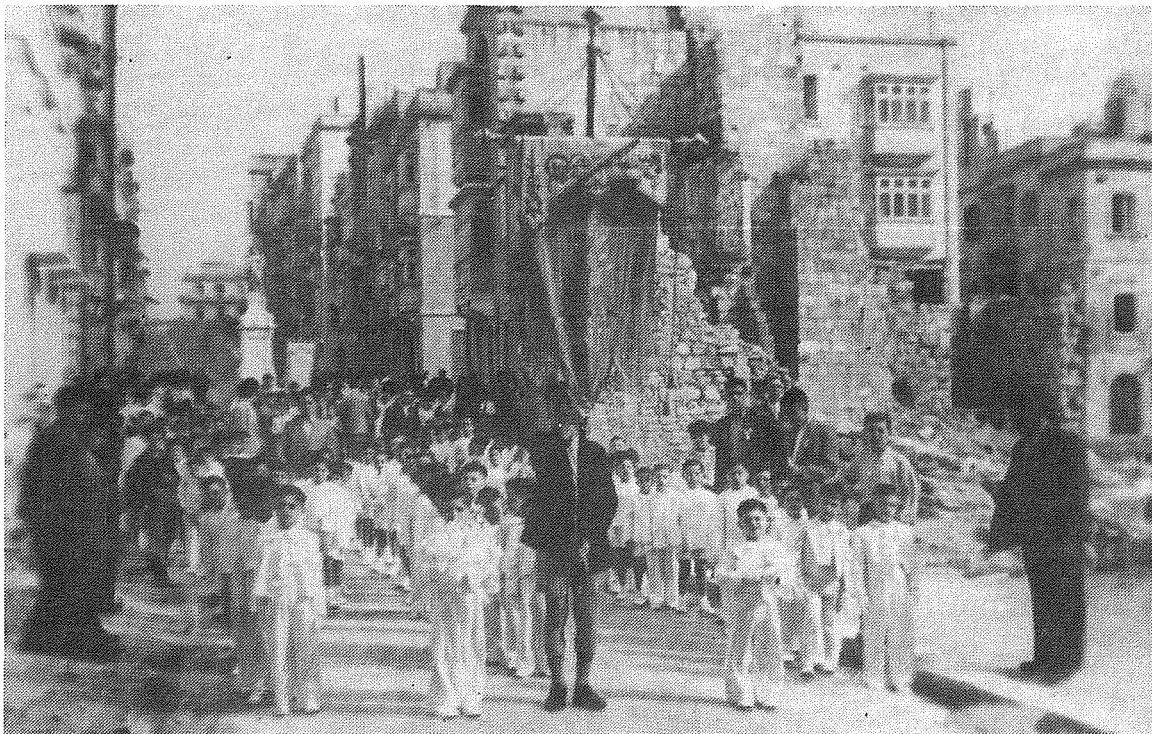
Purċissjoni tal-Ewwel Tqarbina tal-1953 qalb il-bini mwaqqa' fi Triq il-Vitorja