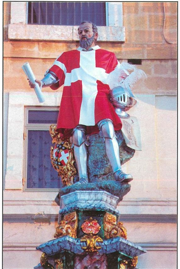
Il-Gran Mastru Klawdju de la Sengle. Statwa li hi parti mill-armor tat-toroq fil-jiem tal-festa. (Alfred Camilleri Cauchi 1994).

L-istemma tal-kunjom La Sengle li saret l-istemma tal-Belt Senglea.