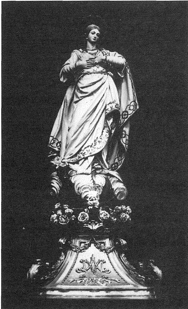
L-Immakulata Kuncizzjoni. Xogħol fl-injam minn Mariano Gerada

Imbagħad, fis-snin bikrin tas-seklu 19, l-imsejtni tal-fratellanza tal-Kuncizzjoni, hasbu biex ikollhom vara li tirrafigura l-Konċepiment Immakulat tal-Madonna, u li tkun propjeta tagħhom, u tintuża esklużivament fil-purċissjoni li l-fratellanza kienet torganizza fil-Hadd ta' wara t-8 ta' Diċembru - festa liturgika tal-Kuncizzjoni. Għal dan il-ghan, huma kkummissjonaw lill-iskultur ċelebri Mariano Gerada, meqjus bhala l-aqwa skultur ta' dik l-epoka, biex jonqox fl-injam din l-istatwa. Il-vara tlestiet fis-sena 1804, 200 sena ilu, u kulhadd jaqbel li hija wahda mill-isbaħ, jekk ukoll mhux l-isbaħ, statwa tal-Kuncizzjoni fil-gzejjer Maltin.