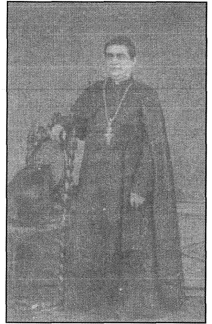
L-Arċipriet Dun Franġisk Colombo

Is-sena 1897 gabet maghha bdil fit-treġġja tal-Parroċċa ta' l-Isla, meta l-Arċipriet, il-Kanonku Dun Franġisk Colombo, li kien ilu jmexxi l-Parroċċa ghal tul ta' 18-il sena shaħ, cioè mill-1861, inhatar Kanonku Monsinjur tal-Kattidral, u ghalhekk kellu jirrinunzja minn Arċipriet tal-Kollegġjata. Il-parrokat ta' Colombo ġie fi żmien meta l-popolazzjoni ta' l-Isla kienet qed tikber hafna, u waqt li kien hawn hafna haddiema foqra, kien hawn ukoll hafna saċerdoti, professjonisti u nies tas-sengha u ta' l-arti. Fost is-saċerdoti li kienu jghammru fl-Isla fi żmien l-Arċipretura ta' Colombo, insibu lill-Kanonku Dun Salvatore Gaffiero, li fis-sena 1899 ġie kkonsagrat Isqof; il-Kanonku Dun Injazju Panzavecchia, li maż-żmien sar Monsinjur tal-Kattidral u li fis-snin bikrin tas-seklu 20, kien persuna importanti fix-xena politika ta' pajjiżna; kif ukoll Dun Angelo Raggio, li mis-sena 1882 sa ma miet fl-1928, kien Propostu żelanti ta' l-Oratorjani fil-Kunvent ta' San Filippu.