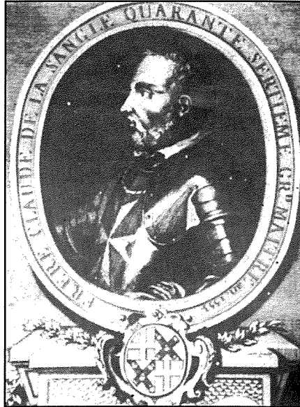
Il-Gran Mastru De La Sengle ried li l-Isla tkun belt ġdida mwaqfa minnu. Għall-Isla, hu wera generożità kbira, u hareġ hafna minn tiegħu biex isahħaha, u jibda jgħammarha bil-Maltin.

Malfreire. Wiehed jinnota u jghid, għalhekk li l-fatt li t-titular huwa San Ġiljan li huwa wkoll il-protettur tal-kaċċaturi. Ma setax jonqos li din il-knisja ma kellhiex rabta mill-qrib mal-hsieb tal-kavallieri, li jdawru l-firxa ta' l-art f'bosk maħsub biex ikun post tajjeb għall-kaċċa.