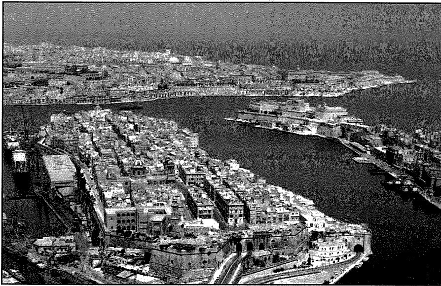
Dehra mill-ajru tal-belt ta' l-Isla.

Meta wiehed ikun fil-Barrakka ta' fuq, u jitfa' harstu għal fuq il-Port il-Kbir, mill-ewwel jaqghu taht ghajnejh, Sant'Anġlu u l-Isla, fil-faccata tiegħu. Fil-lemin tiegħu, tigi l-Isla bi promontorju jisporġi ruħu għal fuq il-baħar kenni, tal-Port il-Kbir. Dan il-promotorju, li fix-xewka tas-sur għandu gardjola mill-isbah, jifred il-baħar mieles f'żewġ dahliet li l-baħar jibqa' diehel sa ġewwanett għalkemm ma jdawwarx il-penisola kollha.