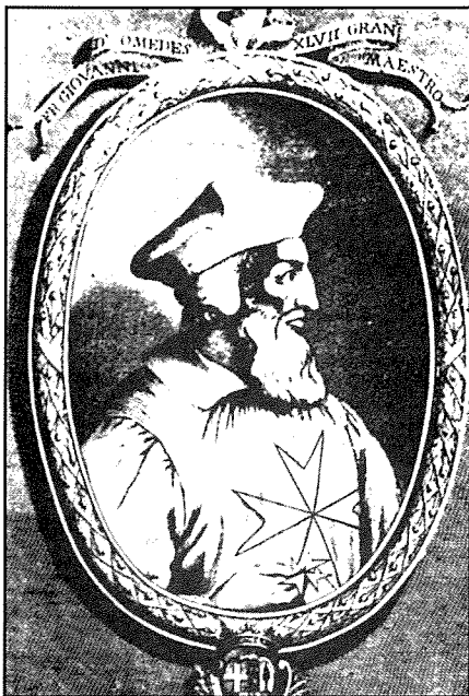
Il-Gran Mastru Juan D'Homedes ipprogetta li l-Isla, jew aħjar, iż-żewġ għoljiet ta' San Ġiljan u tal-Mithna, jissahħu bi swar qawwijin. Dan kien il-bidu tal-Forti San Mikiel. L-inġinier kien Pedro Pardo.

Aktar lejn nofs dan l-ilsien ta' art, fejn iż-żewġ għoljiet jidhlu f'xulxin, u li jiġi faċċata tal-Birgu, kienet tinsab knisja ċkejna ddedikata lil San Ġiljan. Hawn, ta' min iżomm, li l-ewwel knisja ta' San Ġiljan inbniet fl-1311, imma xejn m'hemm dokumentat. Għalhekk l-ewwel bini ċert ta' din il-knisja kien għall-habta ta' 1539, fejn inbniet bil-benevolenza tal-kavallier Portugiż, Fra Diegu De