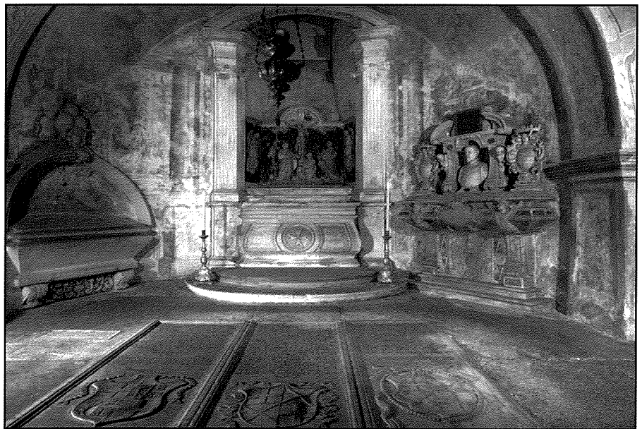
Il-Kripta tal-Gran Mastri li tinsab fil-Konkatedral ta' San Ġwann u li fiha hemm midfun il-Gran Mastru Claude De La Sengle.

Wara Juan D'Homedes, il-kavallieri għażlu Gran Mastru Franciż, bl-isem ta' Claude De La Sengle li dam biss erba' snin (1553-1557). Dan il-Gran Mastru tefa' għajnejh fuq l-Isla, fejn ried jorbot ismu magħha billi nefaq u taha minn tiegħu wkoll ferm aktar milli taha