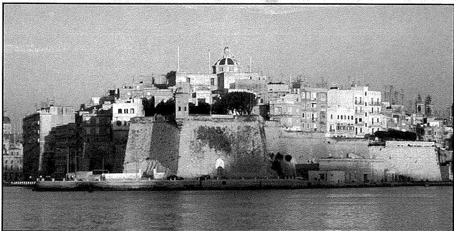
Il-Ponta ta' l-Isla.

kelma Latina insula bit-Taljan isola u għalhekk giet tffisser gżira. Minkejja li mhix gżira totali, minhabba l-ghonq ta' triq li tghaqqad l-Isla ma' Bormla, dan l-isem xorta joqogħdilha għax il-bqija ta' l-art hija mdawra kollha bil-baħar.