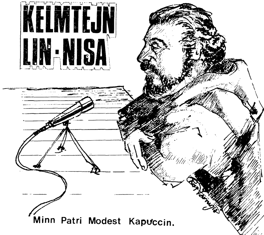
Minn Patri Modest Kapuċċin.