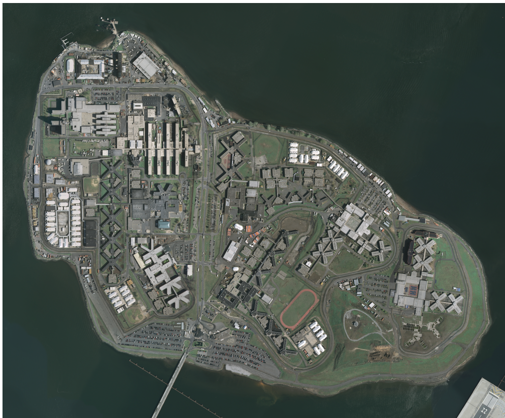
Figure 2. L'île-prison de Rikers Island (New York, Etats-Unis) : un modèle d'optimisation d'un espace insulaire (11 000 agents et civils pour une capacité maximale de 17 000 détenus, sur 1,672 km 2 )