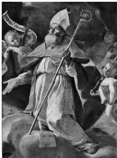
6 – Mattia Preti, San Firmino di Pamplona , 1659, olio su tela. Cappella di Aragona, Catalogna, e Navarra. La Valletta, Co-Cattedrale di San Giovanni Battista