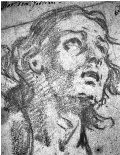
10 – Mattia Preti, Disegno di un'Arco della volta di San Giovanni a La Valletta . La Valletta, Museum of Fine Art

elaborati piedistalli dorati: l'Amore, la Fortuna, il Tempo, e la Fama . È proprio nei giorni di realizzazione degli affreschi della Stanza dell'Aria durante la sua permanenza a Valmontone che Preti ideò e realizzò i disegni su carta (Fig. 9) delle scene del più straordinario ciclo pittorico del barocco italiano fuori dai confini nazionali: la volta della Chiesa Conventuale dei Cavalieri di San Giovanni a La Valletta con le Storie di San Giovanni Battista che Preti iniziò a dipingere appena giunto a Malta nel settembre del 1661. Alcuni di questi straordinari disegni sono conservati a La Valletta (Museum of Fine Arts) (Fig.10). Dagli ultimi giorni dell'estate del 1661 e fino all'autunno del 1666, l'artista si dedicò alla realizzazione della magnifica decorazione che viene considerata la 'Cappella Sistina del Barocco'. In circa 400 metri quadrati, dipingendo con la inusuale tecnica dell'olio su pietra, Preti raffigurò: nel catino absidale la trionfale scena dell' Apoteosi di San Giovanni Battista , sulla grande volta a botte le Storie del Battista suddivise in 18 episodi 43 e