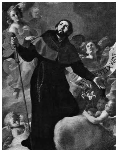
5 – Mattia Preti, San Francesco Saverio , 1658, olio su tela, Cappella di Aragona, Catalogna, e Navarra. La Valletta, Co-Cattedrale di San Giovanni Battista

d'Obbedienza. Nel dipinto per de Redin Francesco Saverio (Fig. 5) è raffigurato a figura intera con l'abito scuro e il bordone da pellegrino mentre rivolge il giovane volto al cielo. L'opera venne realizzata con straordinaria maestria e cura, come il recente restauro 18 ha messo in luce. Preti volle dar prova di tutto il suo talento in modo da stupire il gran maestro e i Cavalieri suoi confratelli, innescando così un legame di stima destinato a proseguire con nuove e importati commissioni per la cappella della Lingua d'Aragona-Catalogna-Navarra che introdussero a Malta l'esuberanza del linguaggio figurativo più prettamente barocco.