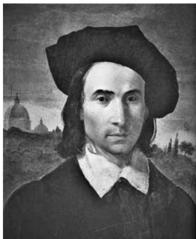
2 – Giuseppe Hyzler, Autoritratto , olio su tela. La Valletta, Museum of Fine Art