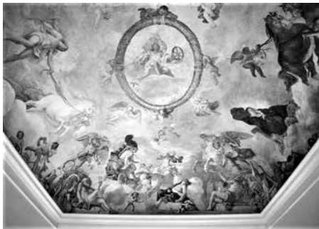
8 – Mattia Preti, La Stanza dell’Aria , 1658, affresco, particolare. Valmontone (Roma), Palazzo Doria Pamphilj

marzo del 1661. De Hozes, infatti solo qualche mese prima di morire, aveva intrapreso il rinnovamento della Cappella di Castiglia-Leon-Portogallo, con l’intenzione ‘di accomodar l’Altare riducendolo alla forma di quello di San Giorgio, facendovi far un nuovo quadro e due altri per sopra le porte o siano arcate [cioè le due lunette delle pareti laterali] come quelli della medesima Cappella di San Giorgio della Veneranda Lingua d’Aragona’. 39 Le due lunette con San Lorenzo dipinte da Preti prese a modello da de Hozes prima della sua morte all’inizio del 1661, dovevano essere state completate prima di tale data e comunque non oltre la partenza del pittore da Malta nel novembre 1659 per recarsi prima a Napoli e quindi a Roma; elementi che confermano quindi la realizzazione delle Storie di San Lorenzo negli stessi mesi nei quali realizzò gli altri dipinti per de Redin.