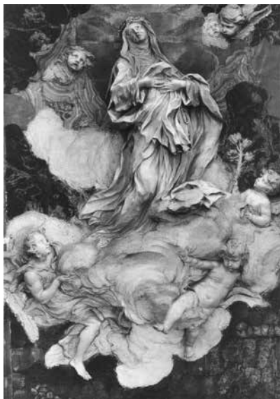
13 – Melchiorre Cafà, La Gloria di Santa Caterina da Siena , Marmo di Carrara, alabastro e lapislazzuli. Roma, Chiesa di Santa Canterina da Siena a Magnanopoli

Ebbe inizio così la carriera maltese dell'artista che durerà quattro decenni, durante i quali dipinse decine di tele per le chiese dell'isola 45 oltre che per committenti italiani.