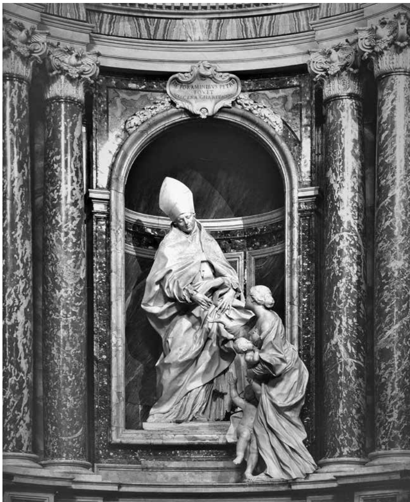
11 – Melchiorre Cafà, L'Elemosina di San Tommaso da Villanova , Marmo di Carrara. Roma, Chiesa di Sant'Agostino

infine sulla controfacciata il Trionfo dell'Ordine di San Giovanni . 44