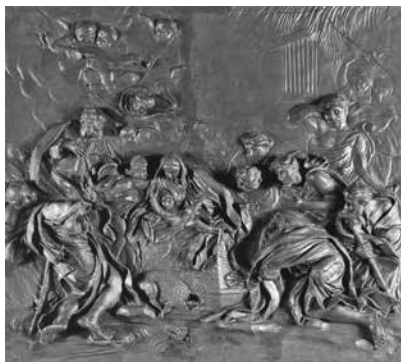
14 – Melchiorre Cafà, La Gloria di Santa Caterina da Siena , bozzetto in cera rossa. Mdina, Museo della Cattedrale