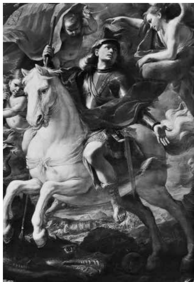
7 – Mattia Preti, San Giorgio ed il drago , 1659, olio su tela. Cappella di Aragona, Catalogna, e Navarra. La Valletta, Co-Cattedrale di San Giovanni Battista

Cotoner (1660–63) e Nicolas Cotoner (1663–80). Grazie ad una lettura iconologica è stato possibile ipotizzare una datazione entro il magistero di de Redin 24 e comunque al 1659, finalmente confermata grazie alle osservazioni scientifiche presentate in previsione del restauro. 25 Anche l'analisi dello schema compositivo del dipinto che ripete quello già sperimentato per il San Francesco Saverio sembra confermare il vincolo progettuale fra le immagini dei due santi. San Firmino infatti è raffigurato stante tra una coltre di nubi dense e corpose, il volto è rivolto al cielo mentre, in modo speculare al gesto compiuto dal Francesco Saverio , con la mano destra indica in basso verso la zona occupata dall'altare, dando luogo a un'armonica interazione nello spazio unico della cappella.