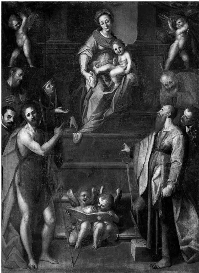
1 – Filippo Paladini, La Madonna di Malta , 1589, olio su tela. La Valletta, Palazzo Arcivescovile.