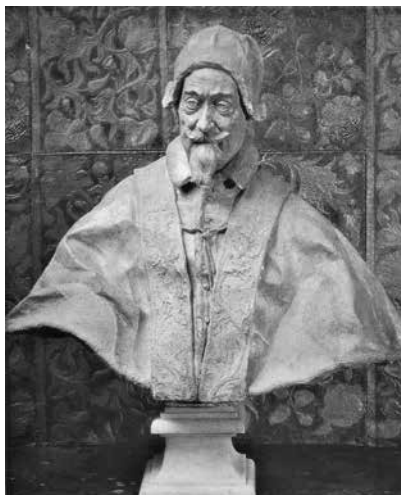
12 – Melchiorre Cafà, Papa Alessandro VII Chigi , Terracotta. Ariccia, Palazzo Chigi