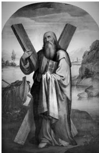
3 – Vincenzo Hyzler, Sant'Andrea Apostolo , olio su tela. Żejtun, Chiesa di Santa Caterina

Francesco de' Medici alla pena della galea e deportato a Pisa. Nel 1589 lo troviamo a Malta ove decorò la cappella del Palazzo Magistrale a La Valletta per il Gran Maestro Ugone de Verdalle. Gli affreschi narrano quattro episodi della Vita di San Giovanni Battista , patrono dei Cavalieri di Malta, oltre a figure di putti e due virtù. Per l'altare della stessa cappella Paladini dipinse su tela la pala con l'immagine della Madonna in trono con i Santi Paolo, Giovanni Battista, ed altri, detta La Madonna di Malta , oggi presso il Palazzo Arcivescovile di La Valletta ove, assieme ad altre opere, decora le pareti di un salone. Il dipinto è firmato e datato: 'Ph. P.P. 1589' e deve essere considerato quale opera di capitale importanza per la storia dell'arte maltese. Non è stata ancora notata, infatti, la straordinaria modernità che La Madonna di Malta (Fig. 1) produsse nel panorama provinciale e per certi versi 'vernacolare' 4 del linguaggio artistico locale. La composizione della Vergine in trono con santi per la prima volta assume una forma e una monumentalità che richiama le composizioni dei grandi artisti toscani. Basti la citazione dei due putti al centro della scena, intenti a leggere un volume sul quale ritorna l'arma del Gran Maestro de Verdalle, che richiama le celeberrime