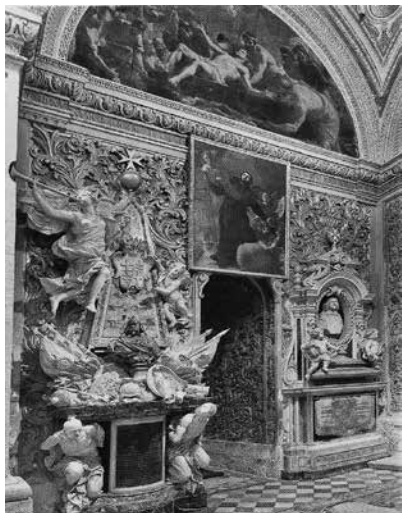
4 – Cappella di Aragona, Catalogna, e Navarra. La Valletta, Co-Cattedrale di San Giovanni Battista. Particolare della parete sinistra. In alto la lunetta con il Martirio di San Lorenzo, di Mattia Preti del 1659; al centro il dipinto di San Francesco Saverio sempre di Preti realizzato a Napoli nel 1658