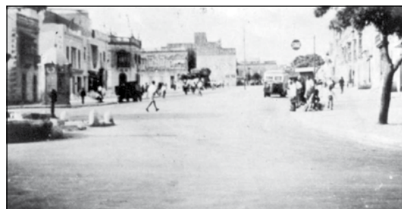
Dehra rari tal-Pjazza ta' Raħal Ġdid fi żmien l-Ingliżi