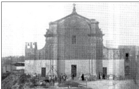
Il-Knisja ta' Santa Ubaldesca fis-seklu dsatax qabel ġiet imkabbra