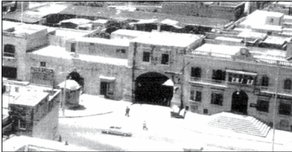
L-armata kif tidher mill-Pjazza li llum intilfet

Il-preżenza tax-xatt ta' Kordin u t-tkabbir tiegħu għall-użu mill-flotta merkantili matul l-ewwel nofs tas-seklu dsatax beda jagħmel minn Raħal Ġdid post imfittex min-negozjanti Inglizi, biex b'hekk ikunu qed joqogħdu f'dar komda u mhux bogħod mill-post tax-xogħol tagħhom.