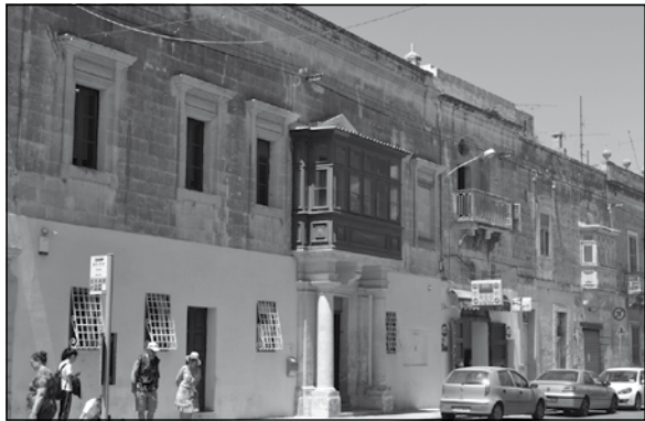
Id-dar ta' Aspinall illum fi Triq Tarxien