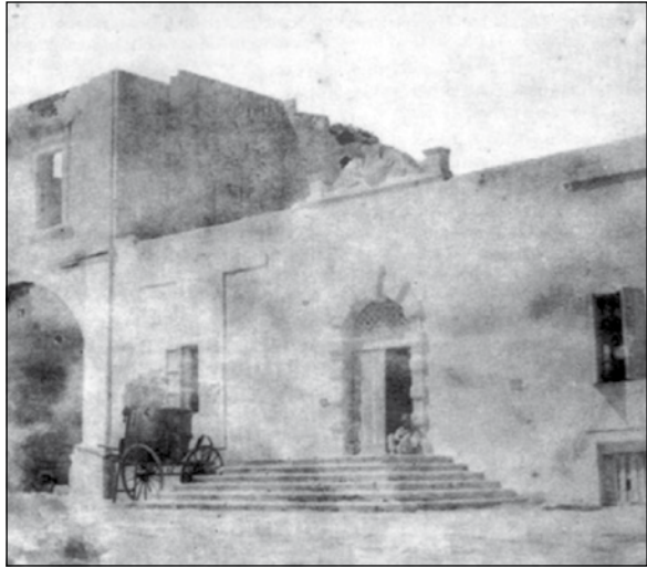
Raħal Ġdid fis-seklu dsatax. Fuq jidher il-bini fejn illum jinsab il-Każin De Paule

Il-listi elettorali jagħtu t-triq eżatta fejn din il-familja kienet marret toqgħod jiġifieri fi Strada Tarxien, ġewwa Casal Paula . Eżattament, il-familja marret toqgħod go dar kbira, li illum hija parti mill-parroċċa u l-konfini ta' Hal Tarxien, jiġifieri dik id-dar, li kienet isservi