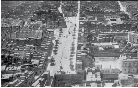
Raħal Ġdid lejn il-bidu tas-seklu għoxrin bil-Pjazza bis-siġar mal-ġnub u l-Knisja qed tinbena