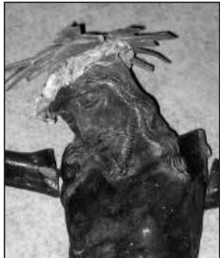
Dettall ta' wiċċ Kristu