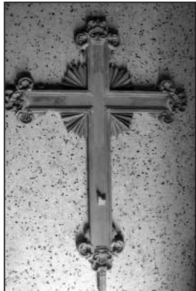
Is-salib waqt ir-restawr

Imbagħad il-parti t-twila tal-kandler tas-salib giet mahduma miċ-ċipress. Min-naha l-oħra s-salib u l-korp kienu mahduma mill-injam tal-punet li wkoll kien injam li jintuża fil-bini tal-bastimenti, iżda kellu l-vantaġġ li jista' faċilment jiġi skolpit. Dan is-salib ma kienx ta' dan il-