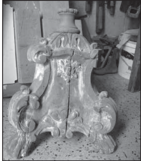
Is-sieq tal-gandlier magħmula mill-elm u qabel ma beda r-restawr

Dawn il-kurċifissi kien ikollhom bażi kbira li kienet tiġi mimlija biramel halli s-salib ma jinqalibx. Is-Sur Muscat reġa' kkrealu l-partijiet in-nieqsa li kellu tal-injam, waqt li ha hsieb ukoll biex jerga' jiżbghu iswed u għal dan ix-xoghol, huwa uża trab li kellu tal-ebbanu (li kien għadu minn ta' żmien missieru) u użah skond kif kienet is-sengħa oriġinali biex b'hekk dan is-salib jerga' jibda jidher li kien qisu tal-