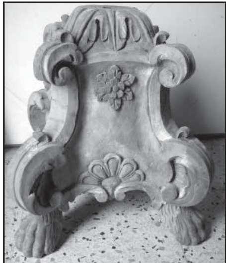
Is-sieq wara li ġiet restawrata