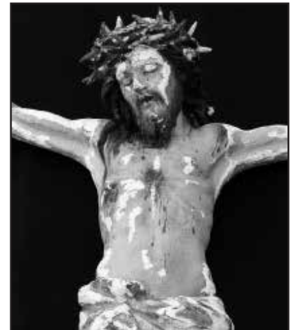
Is-salib Barokk waqt ir-restawr