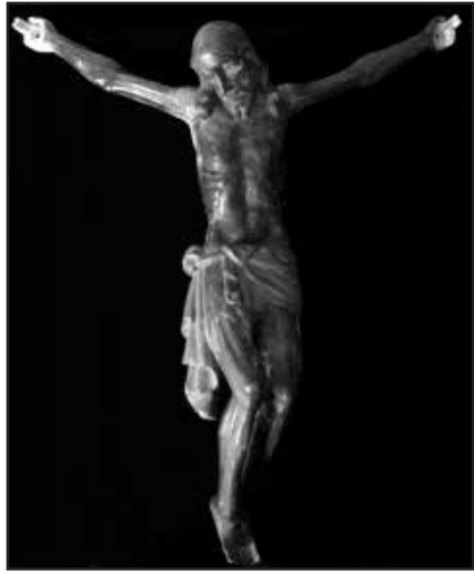
Salib Grieg wara r-restawr tal-injam mis-Sur Muscat

spjegajt fl-artiklu l-iehor, din kienet knisja li tappartjeni ghar-rit Latin. Minn dan l-istudju ta' Debono, nafu li minn din il-knisja kienu salvati żewġ kurċifissi, wiehed kbir li illum qieghed Bormla u iehor hafna iżghar fid-daqs. Dwar dan it-tieni kurċifiss ma nafu xejn aktar. Lanqas ma nafu x'kien sar mill-oġġetti sagri l-oħra li kienu nġiebu miegħu minn din il-knisja. Minn din il-knisja kienu salvati wkoll erba' kolonni polikromatiċi u nduranti, xi gandlieri u vent'artal. F'dan il-każ ukoll ntilef kull traċċa tagħhom. Dawn l-oġġetti kollha kienu nġarru fuq it-tartana mill-belt ta' Kandja, biex ma jaqghux f'idejn it-Torok u