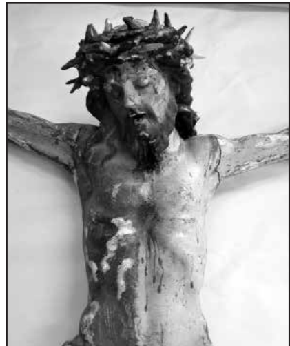
Is-salib Barokk waqt ir-restawr

Wara, dan il-kurċifiss ittiehed għand ir-Recoop għar-restawr fejn b'paċenzja kbira tqaxxret iż-żebgħa kollha li kien hemm fuqu, saff wara saff u tnehhiet sakemm waslu biex harġet iż-żebgħa tas-saff l-oriġinali. Dan huwa proċess