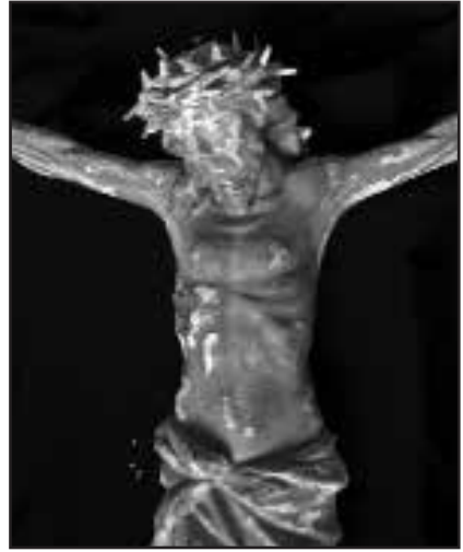
Salib Barokk qabel ir-restawr