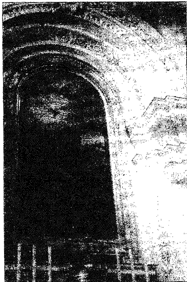
l-istess gvernatur ried din l-immaġni jew kwadru fis-sena 1622 li kienet taħbat is-sitt indizzjoni.